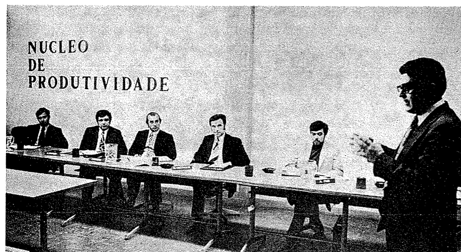
Figura 3. Colóquio: o dirigente e a formação do pessoal, Indústria de Moçambique, vol. 3, n.º 4, 1970, p. 141.

trabalho, encontravam-se entre os temas das formações. Da metrópole chegaram vários especialistas, gestores, economistas, professores universitários – do ISCEF, do Instituto Superior Técnico –, membros de órgãos estatais, de ministérios vários, de organismos como a Comissão Técnica de Planeamento e Integração Económica de Moçambique ou o Instituto Nacional de Investigação Industrial, quadros de instituições financeiras e empresariais, como o Centro de Investigação da CUF ou a Companhia de Seguros Império.