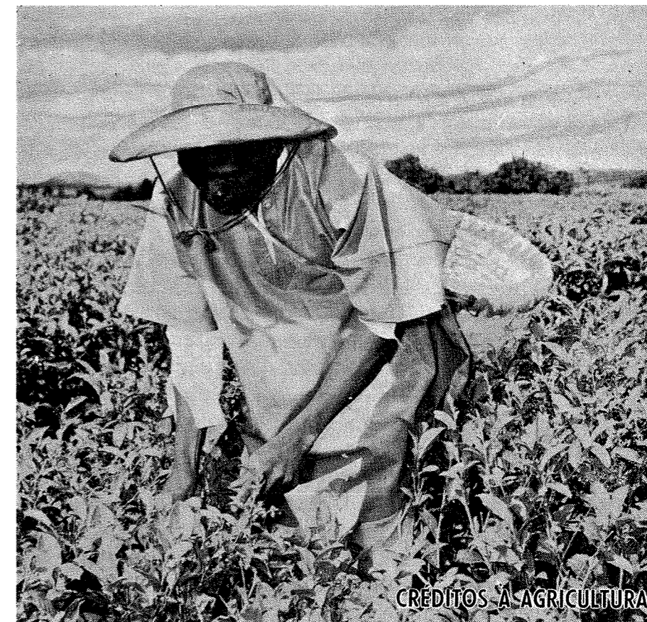
Figura 1. Anúncio do Banco Nacional Ultramarino à Concessão de Créditos Agrícolas. O anúncio aparece com regularidade ao longo dos anos da segunda série da revista.

introduzem rupturas simbólicas, nomeadamente na representação da diferença social e das relações de poder. Assim, estas imagens construíam distintamente a diferença em contexto colonial: a desigualdade social, vinculada à inserção laboral, deixa de ser constituída enquanto atributo da cultura, do costume ou da tradição e passa a ser representada pelas categorias económicas da fábrica, onde a origem étnica e cultural parece esvanecer-se.