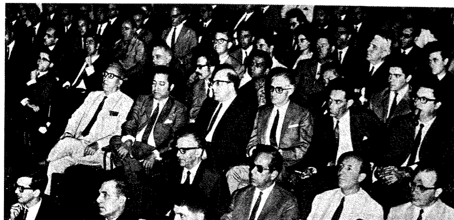
Figuras 2 e 3. Curso de Acção Comercial. O Marketing na Empresa. Indústria de Moçambique, vol. 6, n.º 10, 1973, p. 290.