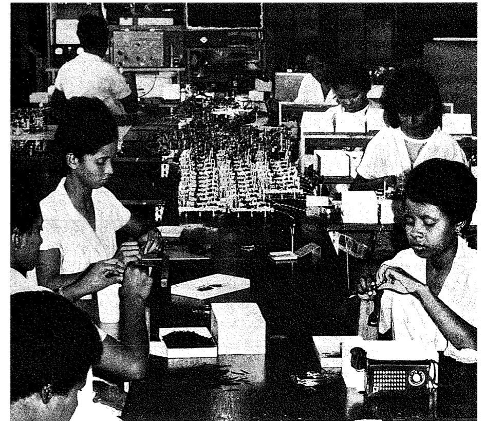
Figura 6. Indústria de Montagem de Rádios, Indústria de Moçambique , vol. 1, n.º 12, 1968, p. 1. Um dos objectivos da dinâmica modernizadora era o de criar operários especializados. Nesta fábrica de montagem de rádios um conjunto de operárias dedica-se a tarefas que exigem olhos atentos e precisos para guiar mãos e dedos ágeis, num trabalho minucioso. Quase todas mulatas, com penteados modernos onde a carapinha, esse símbolo tão forte da origem africana, está ausente, estas operárias seriam bons exemplos de uma classe média africana em formação.

laborais pouco flexíveis e a organização do sistema de ensino e da universidade imprópria para enfrentar as exigências da indústria mais avançada 43 . Discriminatória, a educação colonial fora incapaz de transmitir rudimentos básicos aos alunos e competências laborais mais complexas, o que criava obstáculos ao desejado processo de racionalização da mão-de-obra.