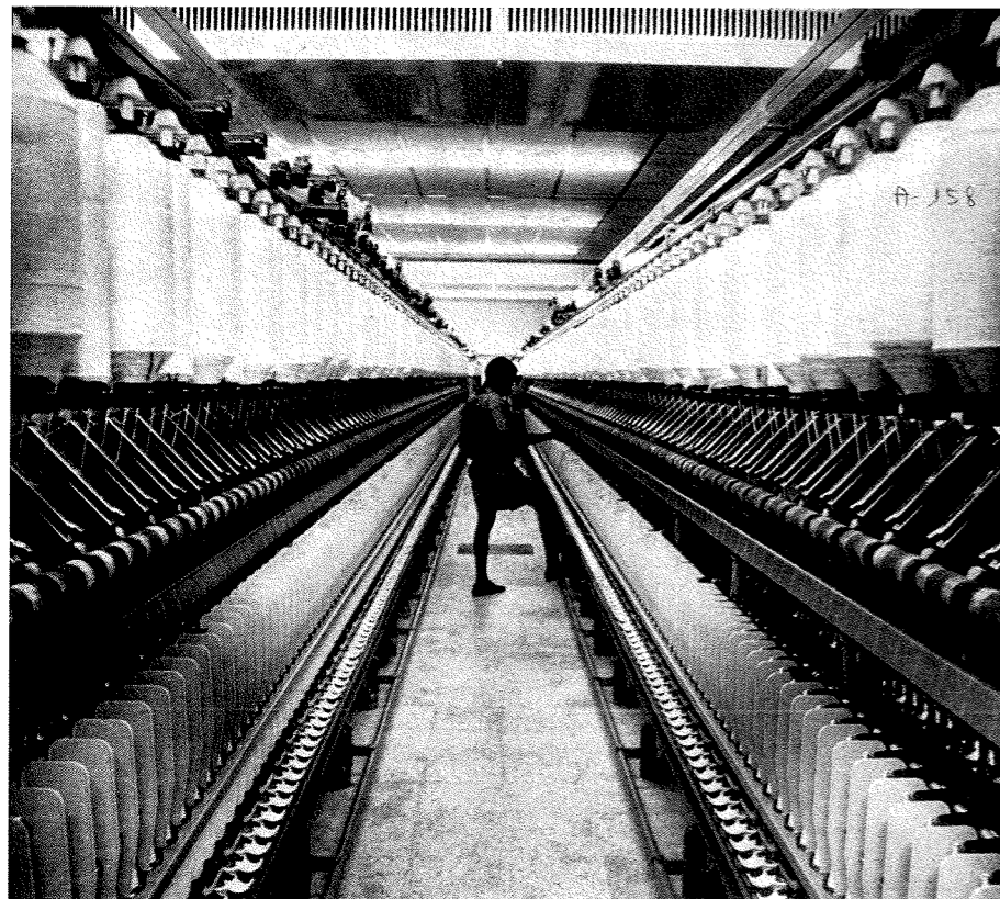
Figura 5. Texlon. Têxtil de Lourenço Marques, Indústria de Moçambique , vol. 6, n.º 4, 1973, p. 1. A paisagem fabril da Texlon coloca o operário africano num cenário que se encontra nos antípodas da construção estereotipada da paisagem africana. Um homem colocado no interior de um espaço desterritorializado que ele passaria, pela experiência do trabalho, a controlar. A perspectiva no plano parece assimilar o operário, a submete-o à sua lógica.

gorias económicas, como as instituídas pela lei do Trabalho Rural aprovada em 1962 39 . O protesto da AIM em relação a esta lei revelava algumas das fraturas que atravessavam o campo do poder colonial. O novo regulamento do trabalho rural, onde não havia qualquer indício de categorização cultural, dirigia-se aos tais “trabalhadores economicamente débeis”. Entre estes incluíam-se os trabalhadores rurais 40 e aqueles que, não possuindo este estatuto, não eram especializados: a grande maioria da força de trabalho africana era constituída por trabalhadores “eventuais”, contratados ao dia, à semana ou ao mês, sem carácter de continuidade, com “residência habitual nas proximidades do local de trabalho” 41 . Esta massa laboral africana não era ainda enquadrada pelo Regime Jurídico das Relações de Trabalho, aprovado em 1956 42 , não podendo ser sindicalizada. Fora das instituições corporativas, os africanos haviam sido remetidos para associações profissionais dirigidas aos indígenas, casos da Associação dos Negociantes Indígenas, dos Carpinteiros, dos Lavadores, dos Barbeiros, dos Sapateiros, dos Pintores, dos Criados de Mesa e dos Alfaiates.