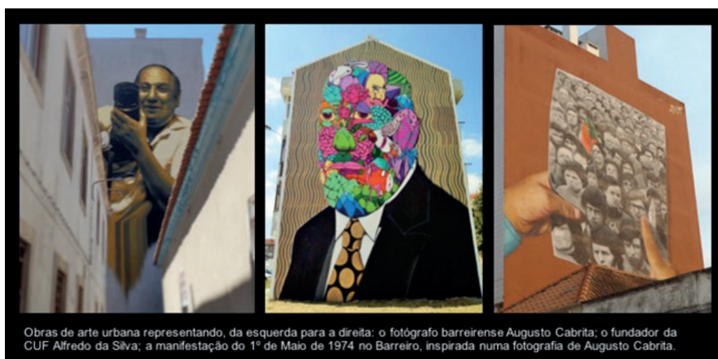
Figura 2 ▶ Representação de memória e identidade local na arte urbana do Barreiro