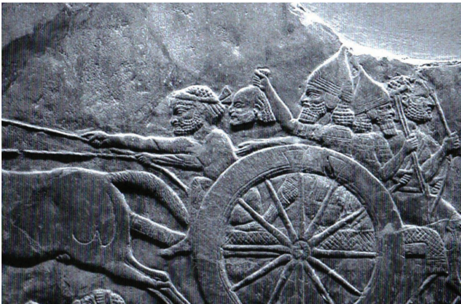
Fig. 4: A cabeça de Teumman sendo despachada para junto do rei assírio. British Museum, ME 124801a.