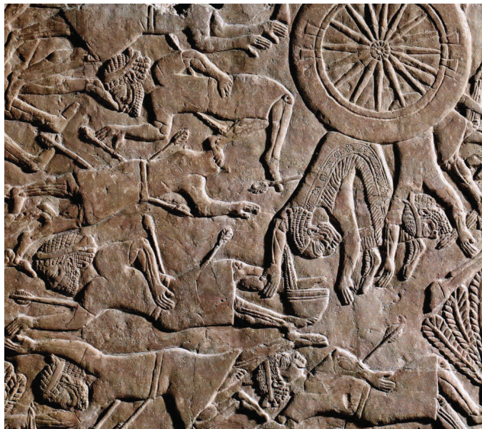
Fig. 2: Batalha de Til Tuba (detalhe). Assurbanípal, Palácio Sudoeste de Nínive. British Museum, ME 124801b.