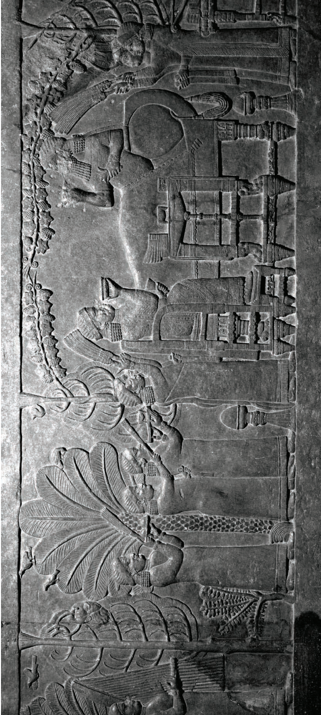
Fig. 5: O Banquete. Assurbanípal, Palácio Sudoeste de Ninive. British Museum, ME 124920.