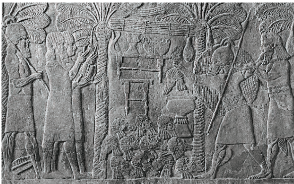
Fig. 7: Escribas contando cabeças e tributos. Palácio Sudoeste de Nínive. British Museum, ME 124825.