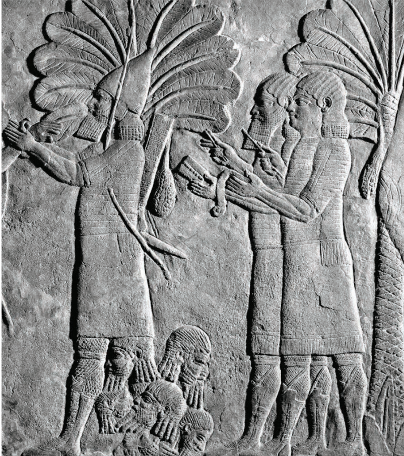
Fig. 6: Palácio Sudoeste de Nínive. British Museum, ME 124955-7.