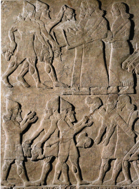
Fig. 1: Palácio de Aššurnasirpal, Kalḫu (Nimrud). British Museum, ME 124550.