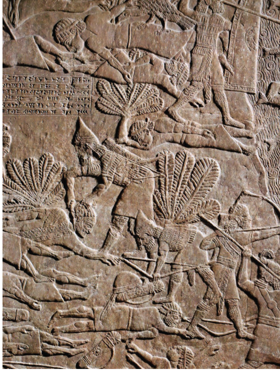
Fig. 3: Teumman sendo decapitado por um soldado assírio. Palácio Sudoeste de Nínive. British Museum, ME 124801c.