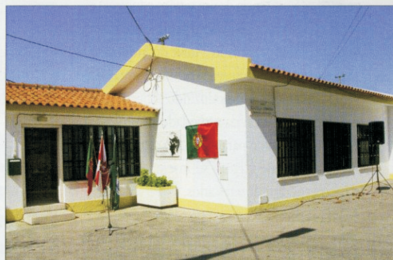
FIGS. 1 E 2 – Logotipo do CEAX e vista exterior do novo equipamento.

dos Castelinhos e a Romanização do Baixo Tejo” (MOCRATE);