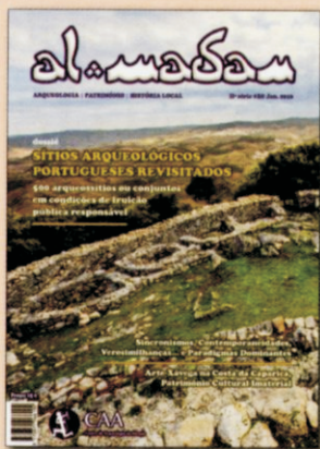
Capa | Luís Barros e Jorge Raposo

Pormenor da muralha do Castro de Sabrosa, povoado fortificado com ocupação da Idade do Ferro à Alta Idade Média. Também conhecido por "Castelo dos Mouros", está classificado como Imóvel de Interesse Público.