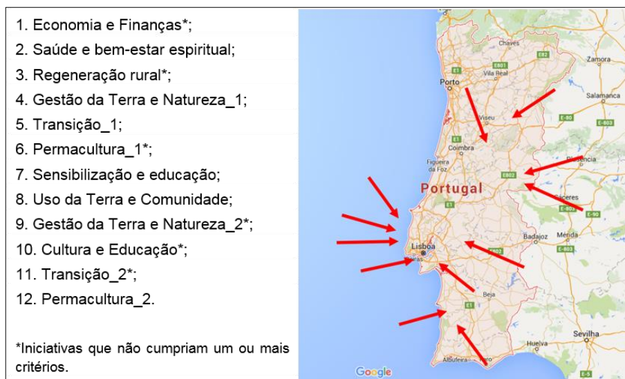
Figura 2 – Lista das iniciativas de base da amostra e sua localização aproximada.