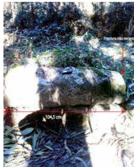
Foto 2 - Miliário de Casais 1 - Vista longitudinal.