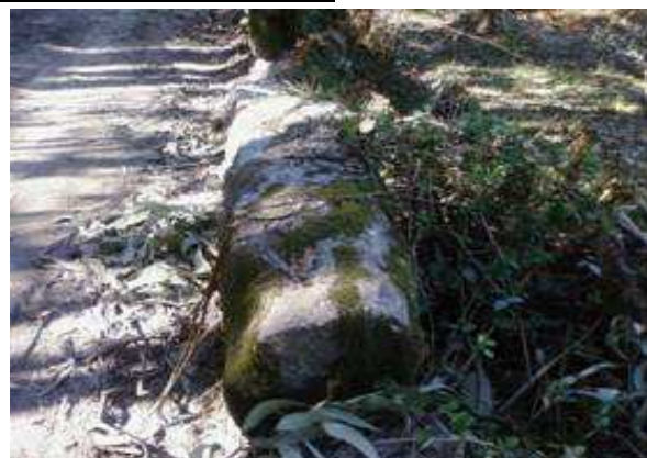
Foto 1 - Aspecto do provável marco miliário de Casais 1.