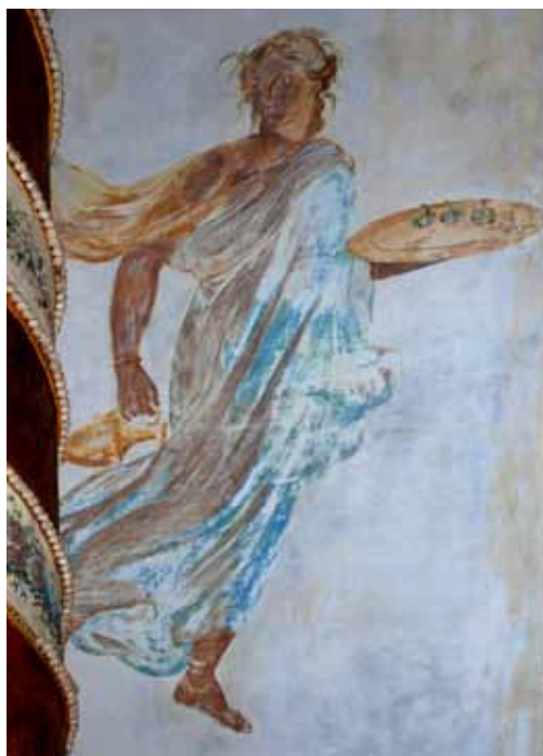
Ilustração 1 Gravura do álbum L'Antichità , Tomo I, 1757, de Camillo Paderni e Filippo Morghen. A mesma figura na parede oeste da Sala Pompeia.

que voam para trás sugerindo o efeito de um salto ou de uma corrida, tudo parece exprimir a figura de uma dançarina 49 , e a bailarina 4: Apresenta um bonito colar à volta do pescoço e dupla fileira de pérolas nos pulsos. A veste é branca com bordados vermelhos. As sandálias têm fitas vermelhas 50 .