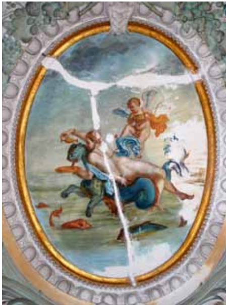
Ilustração 4 Medalhão do lado este da Sala Pompeia com representação de Ninfa ou Nereide sobre monstro marinho.