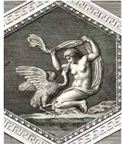
Ilustração 8 Figura mitológica Leda e o Cisne, pormenor da parede sul da Sala Pompeia.

di Tito e loro interne pitture 60 . Também conseguimos encontrar semelhanças com as figuras que compõem as gravuras da obra de G. Volpato, e da obra de Francisco de Holanda, Os desenhos das antigualhas 61 , de 1538-1541.