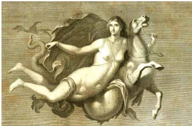
Ilustração 2 Medalhão do lado sul: Ninfa ou Nereide sobre cavalo-marinho.

temos uma Nereida pode chamar-se ao mesmo tempo uma Ninfa pintada delicadamente e gentilmente (...). O pano que esvoaça no lado direito da imagem e envolve-lhe os ombros a