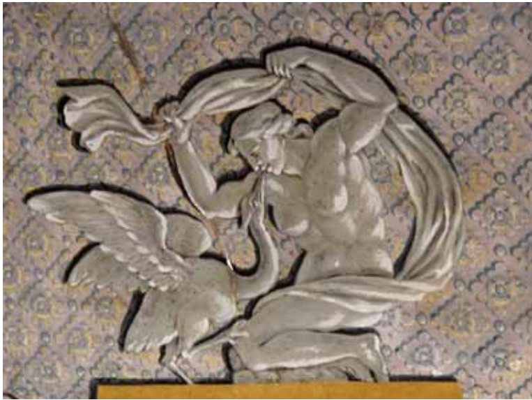
Ilustração 8 Figura mitológica Leda e o Cisne, pormenor da parede sul da Sala Pompeia.