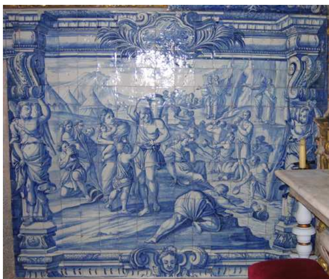
Fig. 134 - Dar de beber aos que têm sede

Cada pano murário apresenta um painel de maiores dimensões no registo inferior e, no superior, com a janela ao centro, dois de dimensão mais reduzida, e de desenvolvimento vertical. Estabelece-se assim uma ligação entre ambos os panos, embora não seja possível definir uma ordem de leitura, a não ser cruzada. Neste sentido, é difícil determinar que enunciado das obras de misericórdia pode ter servido na concepção deste programa, mas