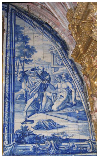
Fig. 136 - Remir os cativos

O painel seguinte levanta, também, uma série de questões, a primeira das quais