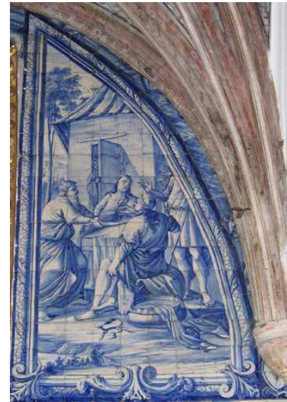
Fig. 139 - Dar pousada aos peregrinos e pobres

A última obra, dar pousada aos peregrinos e pobres tem vindo a ser entendida como a passagem que relata Abraão, em Manre, a receber três homens misteriosos, oferecendo-lhes comida e água para lavar os pés, sem saber que estes lhe tinham vindo anunciar o nascimento de um filho. Junto à porta de uma casa com telhado de madeira, por onde espreita uma mulher, Sara, estende-se uma mesa, num fundo de paisagem. Observa as figuras que se reúnem em torno da mesa: a da esquerda, Abraão (?), recolhe ou pousa uma série de pratos, duas outras personagens estão sentadas, uma delas de costas, e do lado direito, apenas se observa parte do corpo de um homem, cujo tronco foi cortado por já não caber no espaço da capela-mor. Em primeiro plano, no chão, jazem duas sandálias, uma taça com água e um pano.