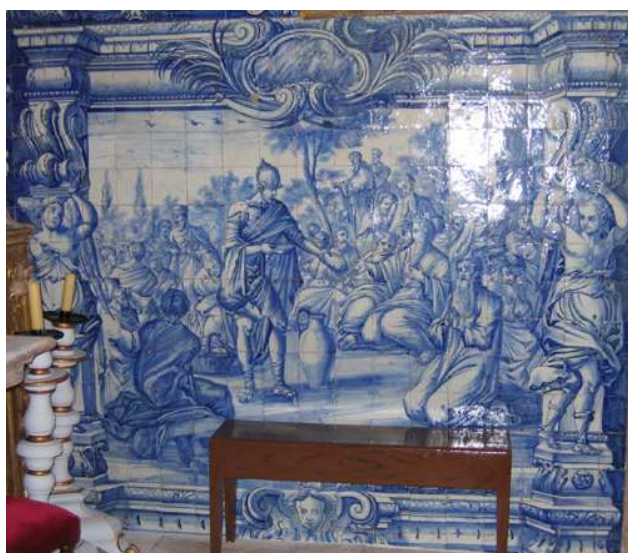
Fig. 137 - Dar de comer aos famintos

figura de cabelo encaracolado parece ajudar. Em primeiro plano, no chão, encontra-se uma trouxa, uma vara e algumas moedas. Tratando-se do bom samaritano, o homem em dificuldades havia sido assaltado, mas do lado oposto aos objectos enumerados estão duas argolas, que recordam as dos presos. Por outro lado, o plano fundeiro é preenchido por uma paisagem e por uma arquitectura estranha, do lado direito, com uma figura sentada. Poderá ser uma alusão à estalagem onde o Samaritano alojou o homem assaltado? Este painel resulta ainda mais estranho pela posição anatómica de ambas as figuras, muito pouco natural. Em todo o caso, se o episódio do bom samaritano não se liga directamente aos cativos, ele representa a ajuda ao próximo e a sua salvação, relacionando-se assim com todos aqueles que entregues aos infiéis correm o risco de perder a alma e se converterem a uma fé que não é a católica.