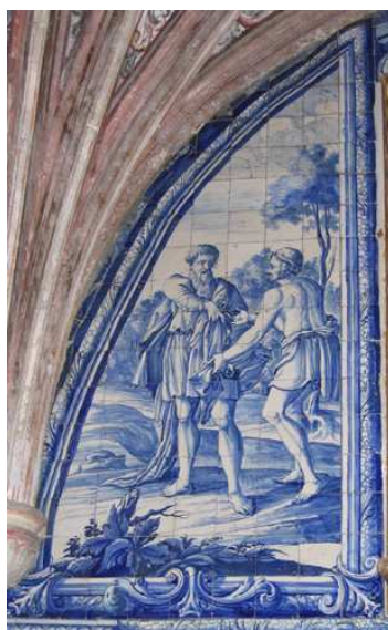
Fig. 135 - Cobrir os nus

têm sede , ilustrada pela história de Moisés, no momento em que este faz brotar água do rochedo (Ex 17; Nm 20). Na sua iconografia habitual, Moisés surge num plano secundário, ao fundo e num esbatido, apontando a vara para o rochedo do qual jorra água de forma abundante, saciando a sede a todos quantos, em primeiro plano, bebem e enchem as suas vasilhas. O plano fundeiro é preenchido por uma montanha e por tendas, mas o elemento que domina toda a composição é o rio que corre a partir do rochedo de Moisés, e onde todo o povo (crianças, homens e mulheres) se banha e sacia a sede. Importa chamar a atenção para a quase certa inspiração desta representação em modelos gravados, de que a figura deitada, de costas para o observador, que procura apanhar água do rio com o seu cântaro, é o melhor exemplo. Mais à frente, um homem bebe directamente no rio. A dama, mais requintadamente vestida e que apenas banha os pés no rio, parece retirada de uma outra gravura, como se houvesse uma colagem, da qual resulta uma representação em que nem todos sofrem da mesma intensidade de sede ou falta de água.