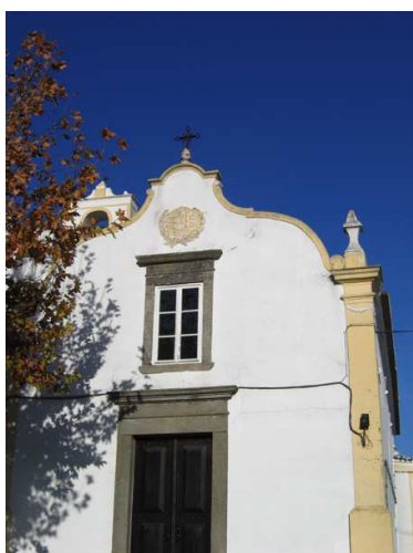
Fig. 133 - Fachada principal

A capela-mor parece ser o espaço interiormente menos alterado, mantendo a abóbada de nervuras polinervadas, com fechos cilíndricos, enriquecida já no século XVII com pintura a fresco de motivos fitomórficos. Só o seu equipamento é posterior: o retábulo pode ser datado da transição do século XVII para o século XVIII, ou seja, do proto-barroco para o barroco, e os azulejos remontam, como veremos a seguir, aos anos finais da década de 1720.