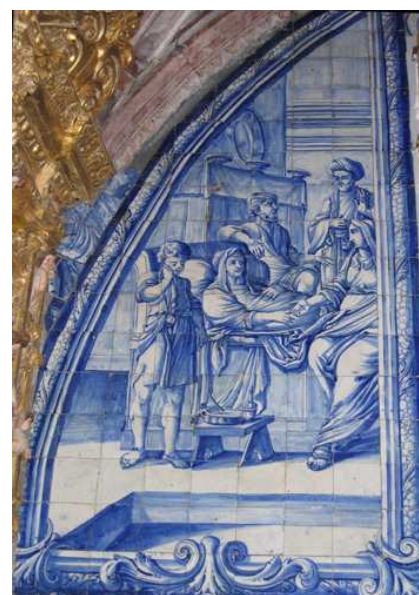
Fig. 138 - Curar os enfermos

Do lado do Evangelho, o registo inferior é ocupado por dar de comer aos famintos . Não foi possível identificar a cena aqui representada onde se destaca um soldado, em pé, no meio de uma multidão de homens e mulheres sentados ou ajoelhados, oferecendo pão com uma mão, enquanto segura num prato com a outra, e tem diante de si uma bilha de água. Atrás, pode observar-se uma cesta