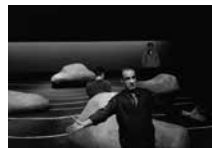
Água Salgada, de Conor McPherson, enc. João Lourenço, Novo Grupo, 1997 (José Jorge Duarte, Paulo Oom, Tobias Monteiro), [F] João Lourenço