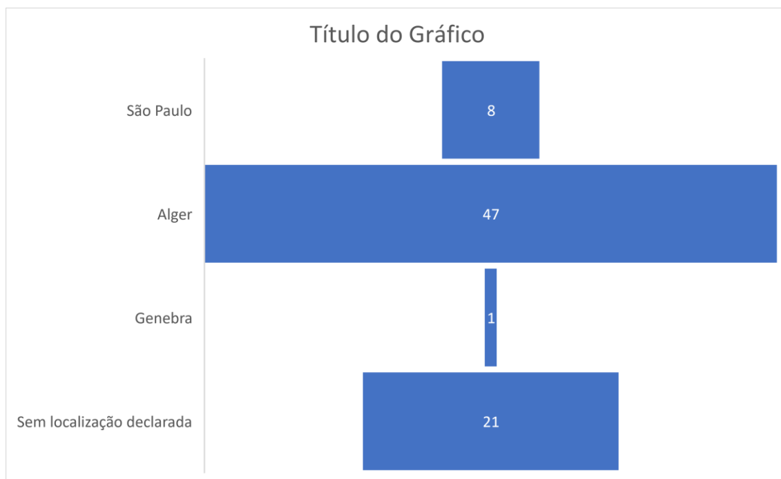
Figura 3. Gráfico representativo dos locais de escrita de Manuel Alfredo Tito de Morais

assente na missiva (carta de 19 de Junho de 1965)) por via das deslocações que fazia até às reuniões com os seus camaradas Ramos da Costa e Mário Soares. É possível assumir que as 21 cartas que não apresentam o local de escrita foram escritas a partir de Alger. Ramos da Costa escreveu a partir de Paris, o seu local de residência e trabalho.