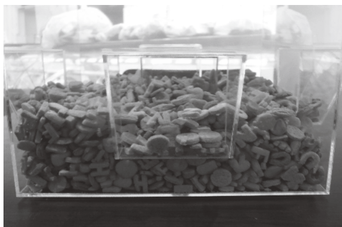
Figura 1 - Márcia Braga, "Comer o Livro", 2014. Instalação (mobiliário, redoma de acrílico e bolachas em formato de letras).