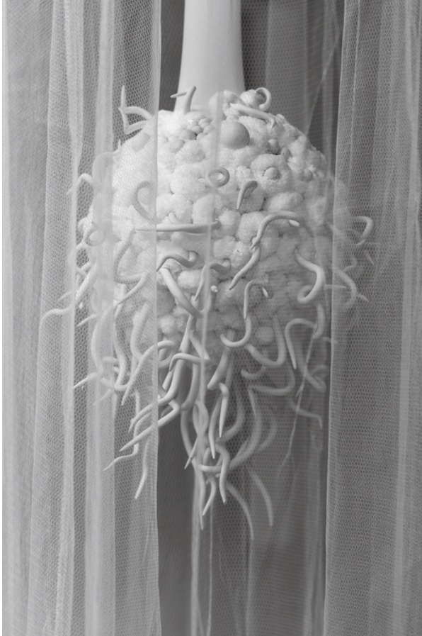
Figura 5 · Márcia Braga, «Este Corpo já foi meu», 2015. Objetos (tecido, linha e cerâmica).