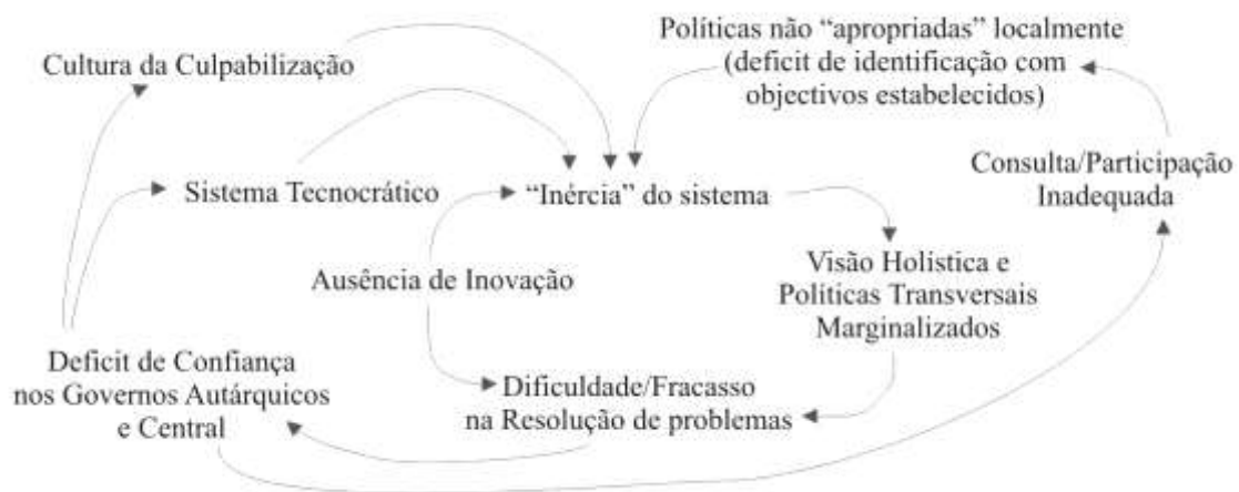
Figura 2: O contexto real

Refira-se que esta lógica relacional, com óbvias adaptações, é comum a múltiplas análises sociais; assim, se no diagrama substituíssemos a palavra conhecimento pela palavra sociedade e se pensássemos no conceito de Agência de Giddens [5], de Poder de Foucault [6] ou Flyvbjerg [7], da teorização da Prática de Bourdieu [8], do Novo Institucionalismo de Powell e Di Maggio [9] todos avançariam em larga medida interpretações das 'lógicas' de articulação entre os elementos aqui identificados. Contudo, a Fig.1 representa, em larga medida, um modelo explicativo estritamente racional e linear [10], um processo aparentemente ordeiro, com uma sequência lógica de passos, equidade na capacidade de influência entre os diferentes actores e a predisposição colaborativa destes para a optimização do processo de criação e utilização do conhecimento. Este dispor ideal das peças constituintes do processo em análise encontra-se longe do contexto real em que a avaliação e subsequente produção de conhecimento, de facto, se dá [11]. De facto, a criação de laços de confiança entre cidadão e Estado, a ocorrer, tem lugar num ambiente (Fig.2) que acarreta uma forte influência modeladora sobre o desenho do processo de avaliação e utilização do conhecimento por ele gerado.