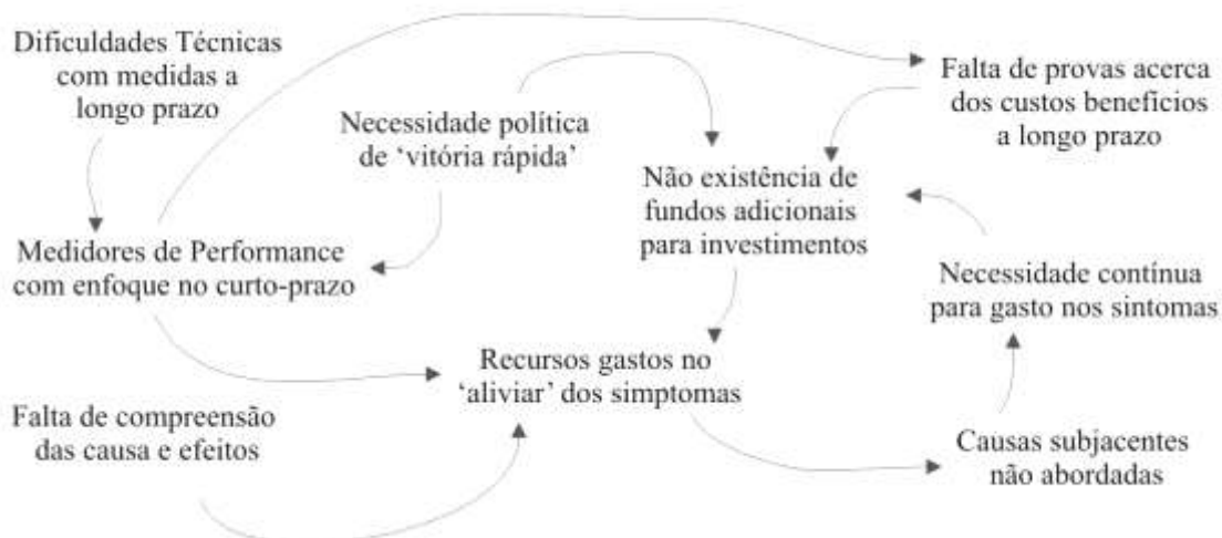
Figura 3: O contexto político-institucional real (adaptado [13])

O decisor político, num regime democrático estável e com relativa transparência funcional, está crescentemente em cheque (Fig.3). A generalização do uso das novas tecnologias e consequente celeridade de actualização e divulgação de informação em larga escala, poder-se-á argumentar, 'força' um aumento da transparência processual e justificativa ao nível da decisão governamental ao multiplicar as formas de escrutínio contínuo da 'decisão' política por parte dos media e sociedade civil em geral. Não querendo debater a validade e implicações éticas de todas estas formas de observação é legítimo argumentar que a pressão delas decorrente pode, à partida, aliciar o decisor político a ter uma visão meramente linear e instrumental da avaliação condicionando pela negativa o seu desenho e amplitude de aplicação.