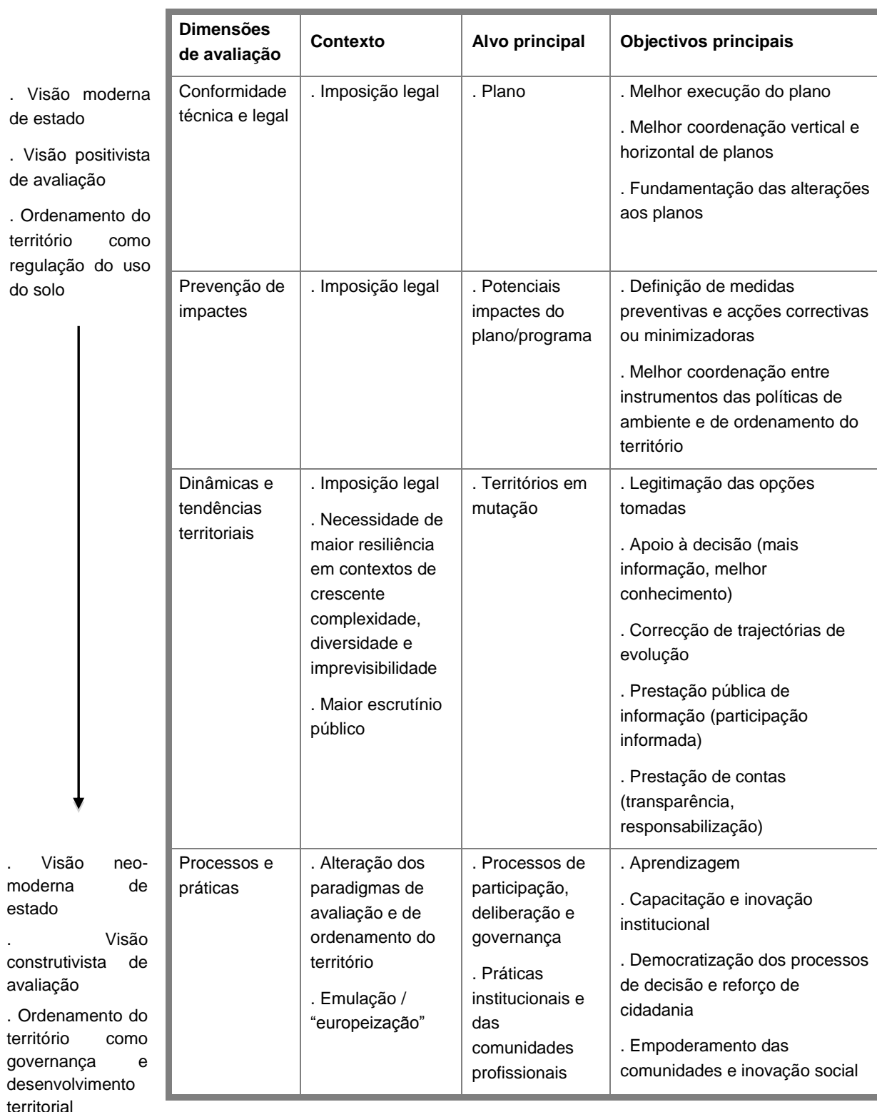
Figura 5: Síntese da evolução da avaliação no domínio do ordenamento do território em Portugal [26]