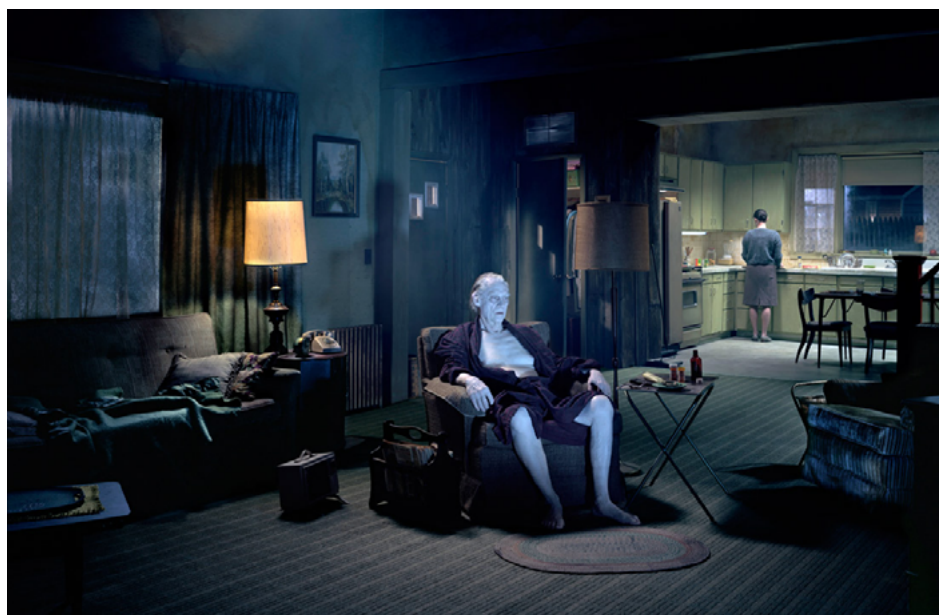
Série Beneath the Roses , Gregory Crewdson, 2003-2005