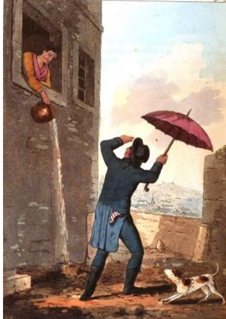
Figura 1 - “Água Vai”, Henri L'Evêque, 1814

negras que transportavam as águas impuras da cozinha e dos quartos para jogá-las ao rio, advindas dos locais mais afastados do centro. “As bacias e os jarros despejavam-se vulgarmente pela janela a fora, gritando-se apenas: água vai” (CHANTAL, 1986, p. 243).