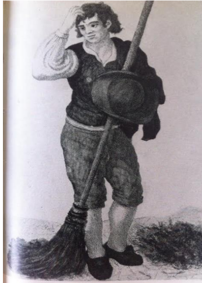
Figura 2 - “Varredor”, Manuel Godinho, 1809

Os escrivães de pena longa, assim eram chamados os varredores, segundo nos aponta Moita (1979, n. p.), que “utilizavam instrumentos rudimentares, vassouras de esparto com cabo alto e em carroção em forma de caixa quadrangular, para onde eram atirados a esmo, todos os detritos, incluindo cães e gatos mortos”. Conforme nos apresenta a obra Costumes of Portugal , de L'Evêque (1814), vê-se como os resíduos eram deslocados por uma carroça de tração animal, ou seja, puxada por bois.