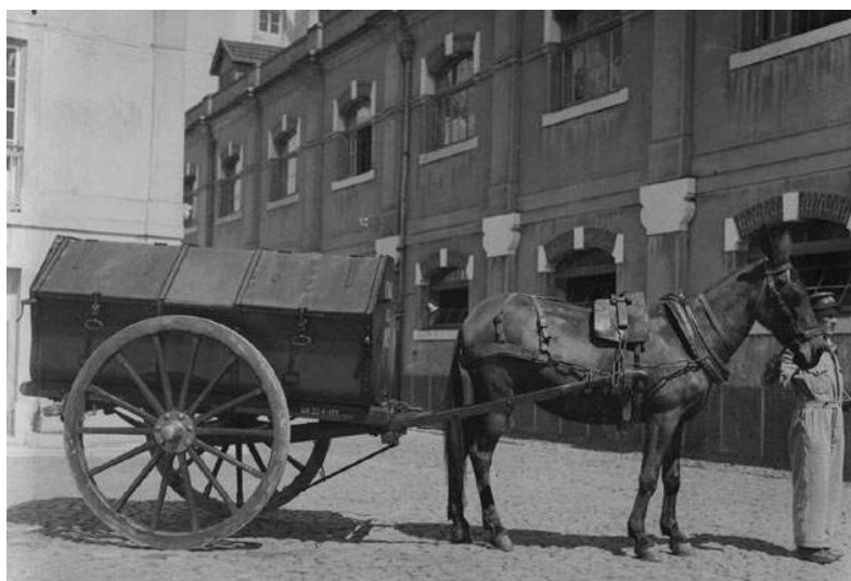
Figura 4 - “Carroça de lixo”, António Passaporte, 1939

condução era feita por apenas um homem, e a quantidade que era transportada também não teve aumento considerável.