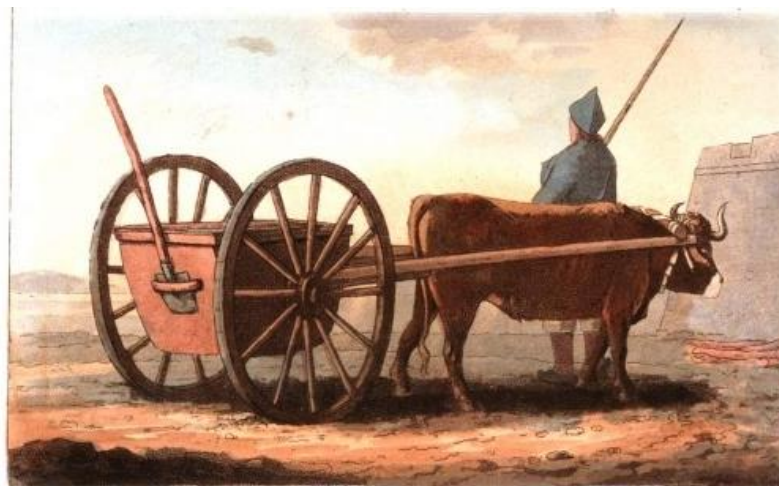
Figura 3 - “O carrinho de Lama”, Henri L'Evêque, Henri, 1814

Os escrivães de pena longa, assim eram chamados os varredores, segundo nos aponta Moita (1979, n. p.), que “utilizavam instrumentos rudimentares, vassouras de esparto com cabo alto e em carroção em forma de caixa quadrangular, para onde eram atirados a esmo, todos os detritos, incluindo cães e gatos mortos”. Conforme nos apresenta a obra Costumes of Portugal , de L'Evêque (1814), vê-se como os resíduos eram deslocados por uma carroça de tração animal, ou seja, puxada por bois.