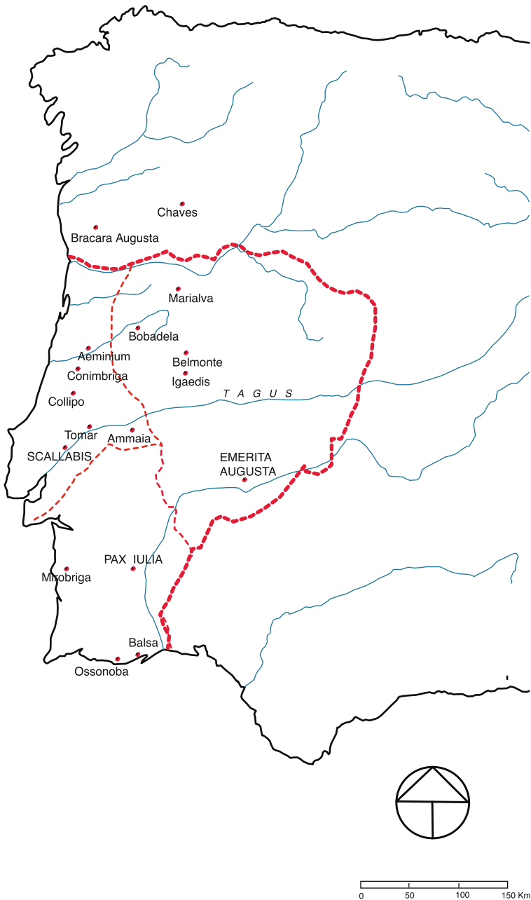
Mapa dos Flávios no ocidente da Península Ibérica (localizações aproximadas).