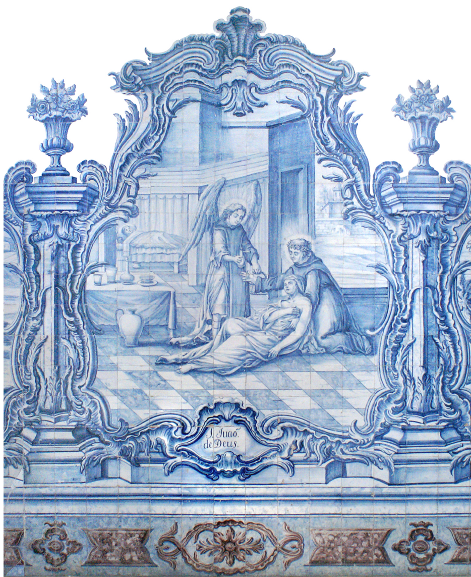
S. João de Deus na Enfermaria, séc. XVIII, Vendas Novas, Capela do Paço das Passagens.