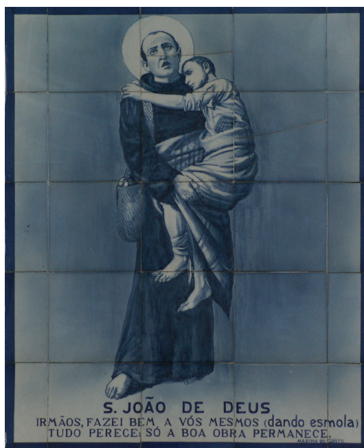
S. João de Deus, séc. XX (1950), Fão, Hospital da Misericórdia