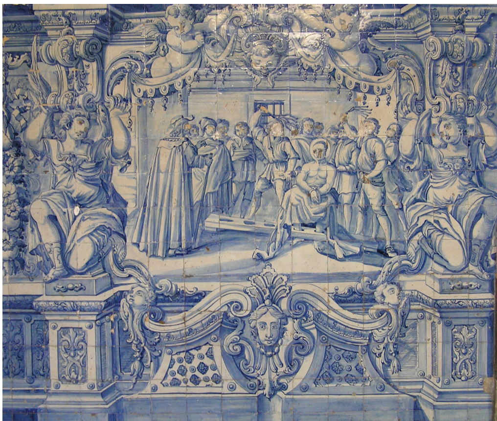
S. João de Deus no Hospital Real de Granada, séc. XVIII, Lisboa, Hospital Convento de S. João de Deus.