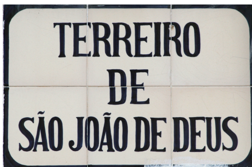
Terreiro de São João de Deus, séc. XX, Montemor-o-Novo.