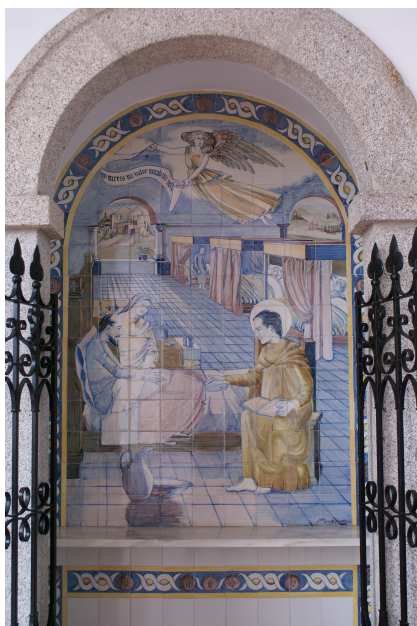
S. João de Deus na Enfermaria, séc. XX, Centro de Saúde Militar de Évora.

Os painéis em análise, são um valioso património para as artes decorativas relacionadas com a Ordem Hospitaleira de S. João de Deus em Portugal, e com o culto dos Santos nacionais.