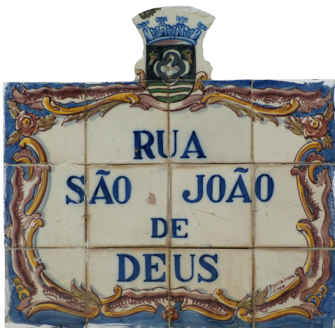
Rua de São João de Deus, séc. XX, Oeiras.