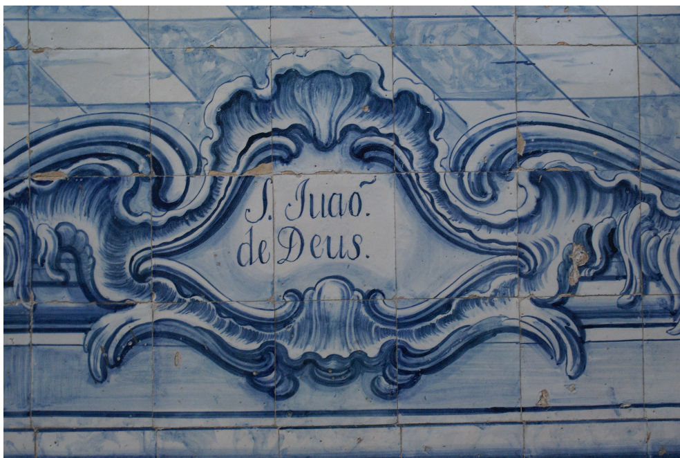
S. João de Deus, séc. XVIII, Pormenor painel da Capela Relá do Paço das Passagens.