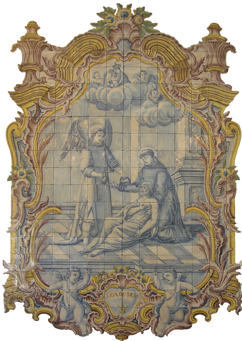
S. João de Deus na Enfermaria, fim do séc. XVIII, Lisboa, Hospital Real de S. José.