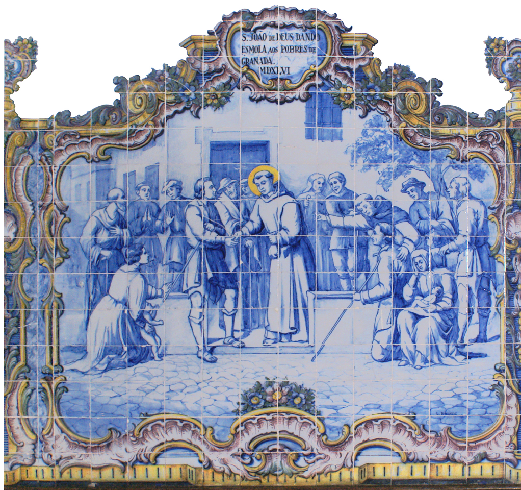
S. João de Deus dando esmola aos pobres em Granada, séc. XX (1936), Montemor-o-Novo, Paços do Concelho.