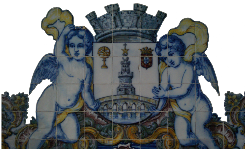
Heráldica Municipal de Montemor-o-Novo, séc. XX (1931), Montemor-o-Novo, Paços do Concelho.

Outros pequenos exemplos continuam a ser produzidos, mas devido à sua profusão não tem cabimento neste trabalho, pois identificamos os que têm mais significado artístico.