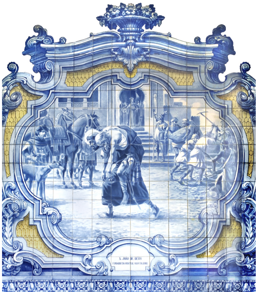
S. João de Deus fundador da Ordem da Hospitalidade, séc. XX (1934), Lamego, Hospital da Misericórdia.