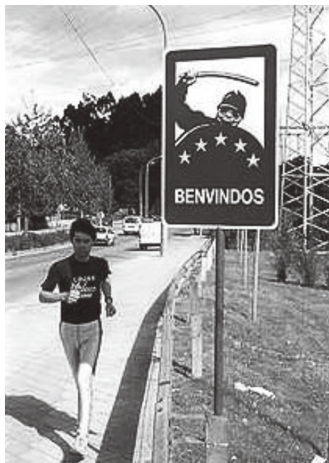
Figura 6 · Rogelio López Cuenca. Kommendes Paradise (Paraíso Venidero) . 1991. Esmalte sobre chapa de hierro.