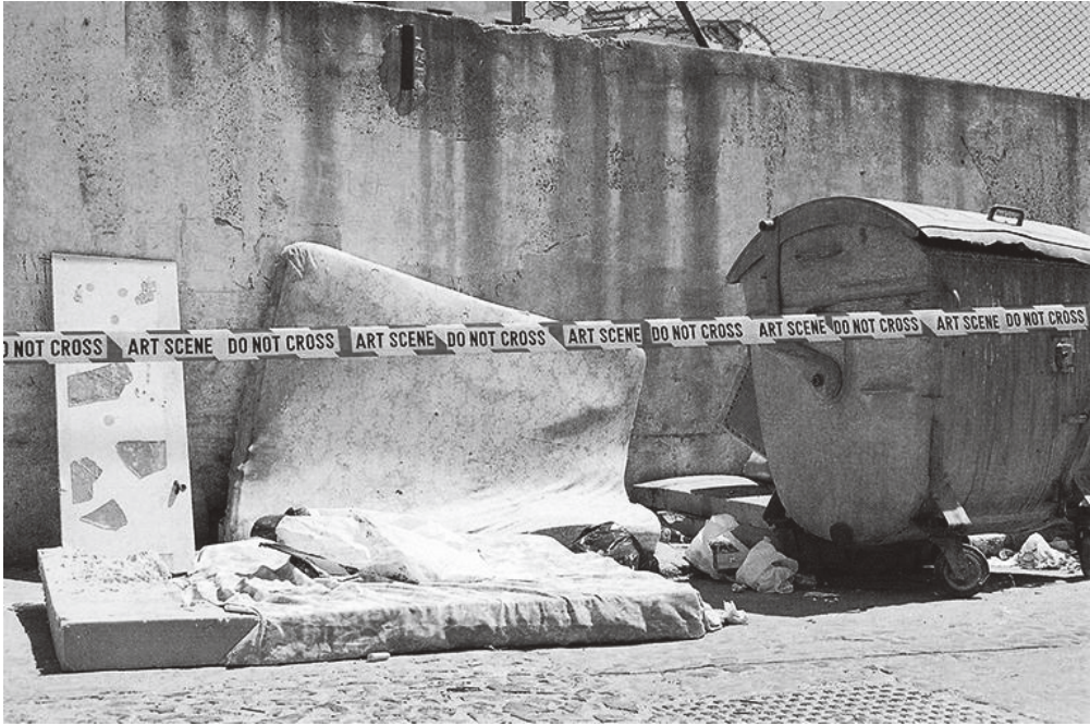
Figura 1 · Rogelio López Cuenca, Elo Vega y Rafael Marchante. Walls , 2006. Fragmento del vídeo de las grabaciones de la valla de Melilla contraponiendo en su parte inferior textos con información financiera.