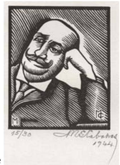
Xilogravura do retrato de Manuel Galdino, de Manuel Cabanas, 1944

Manuel Galdino da Silva falece aos 48 anos, a 1 de abril de 1914.