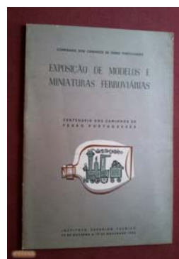
Capa do catálogo da Exposição de Modelos e Miniaturas

Desde então a peça permaneceu no IST, tendo sido colocada, em 1993, no Museu de Engenharia Civil, onde se encontra atualmente exposta.