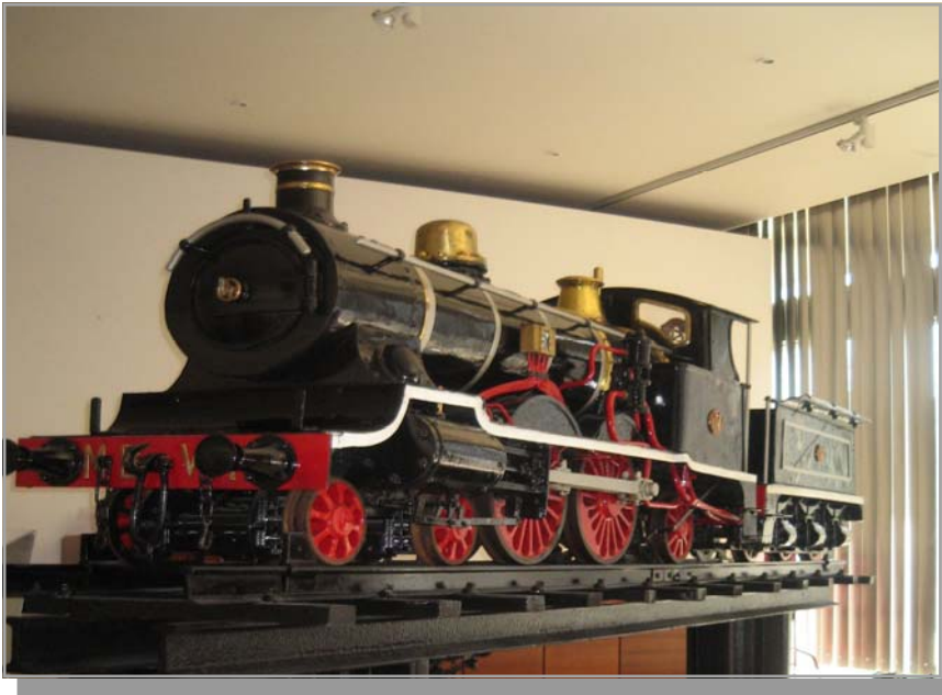
Fotografia locomotiva MBV 1