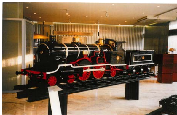
Fotografia da locomotiva no Museu DECivil em março de 1994—cedida por CEC

Desde então a peça permaneceu no IST, tendo sido colocada, em 1993, no Museu de Engenharia Civil, onde se encontra atualmente exposta.