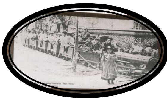
Fotografia da locomotiva em Paço de Arcos

Mais tarde foi instalada na Moita do Ribatejo, na Atalia, e ainda no Porto, no jardim do Palácio de Cristal. Em 1944, há registo de ter sido utilizada na festa de beneficência da corporação de bombeiros de Paço de Arcos, em Oeiras.