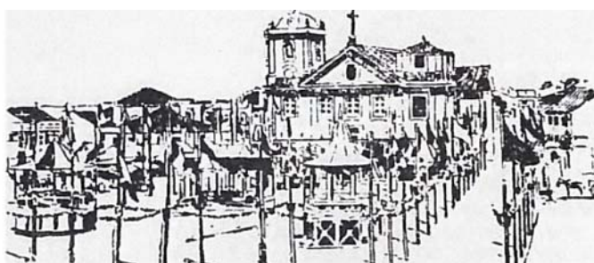
Arrial em honra Nº Senhora do Rosário do Barreiro, In, O Barreiro Antigo e Moderno

A primeira apresentação pública realizou-se em Agosto desse ano, tendo sido a grande atração nas festas de Nº Srª do Rosário, onde a locomotiva circulou sobre 175m de carril, puxando seis vagonetas com capacidade para 4 passageiros cada uma.