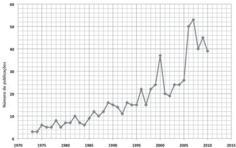
Análise por anos

* Os valores apresentados neste gráfico têm, como em todos os casos do género, um valor meramente indicativo. A sua quantificação teve por base o estudo que realizei desde os anos oitenta sobre a bibliografia que tem sido publicada sobre a temática indicada. Contaram-se, em certos casos, teses que só depois vieram a ser publicadas (embora não tivesse havido uma investigação exaustiva sobre a sua apresentação em universidades portuguesas e estrangeiras) e obras que foram reeditadas porque a sua republicação pode ser significativa. Não foram aqui referidos, obviamente, os múltiplos artigos de revistas, embora o pudessem ser os volumes das revistas dedicados inteiramente à citada temática.