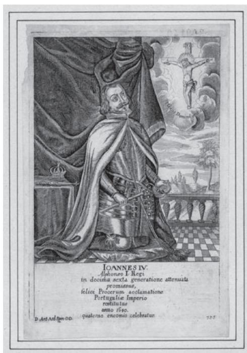
Biblioteca Nacional de Portugal, EA 2A, Series Regum et Principum , nº 40.

Apesar disso, a tradição mantinha uma apreciável importância ideológica e uma vitalidade talvez surpreendentes.