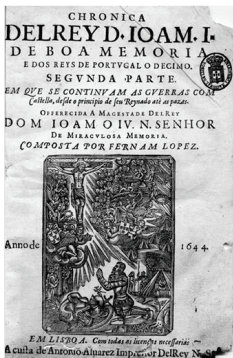
Biblioteca Nacional de Portugal, Fernão Lopes, Crónica de D. João I , 1644.

Na verdade, para os adversários de Herculano, Ourique continuava a representar, na sua dupla vertente de batalha grandiosa e da aparição de Cristo, como