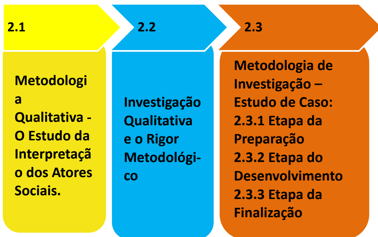
Figura 1 – Fluxograma processos metodológicos