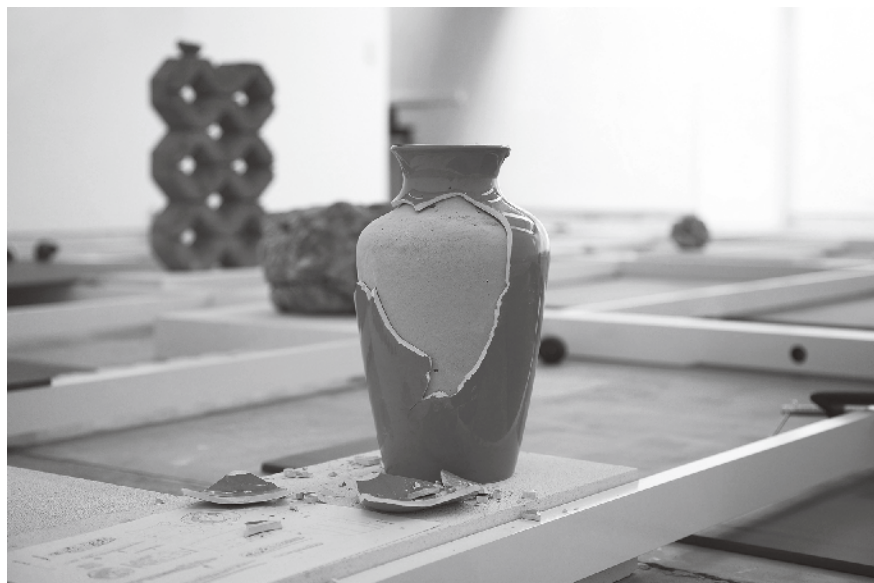
Figura 1 · Nicolás Lamas, Loss of Symmetry , 2016. Vista general de la exposición. Loods 12, Wetteren (Bélgica).