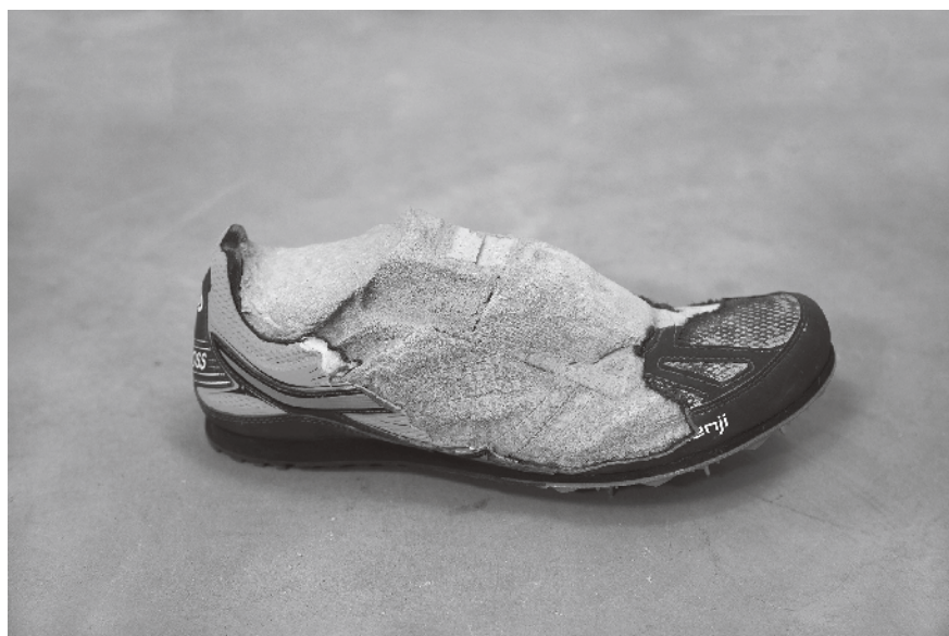
Figura 3 · Nicolás Lamas, Dialogue Table #1 , 2015. Enough room for space, Bruselas (Bélgica).