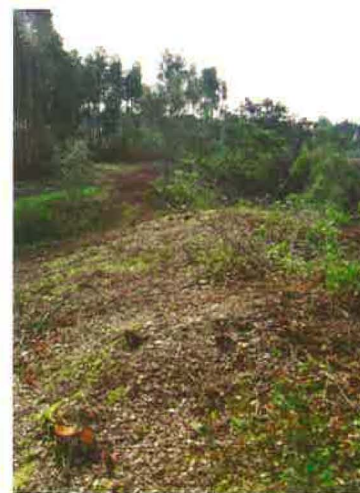
Figura 2 – Muralha em talude dos Chões de Alpompe