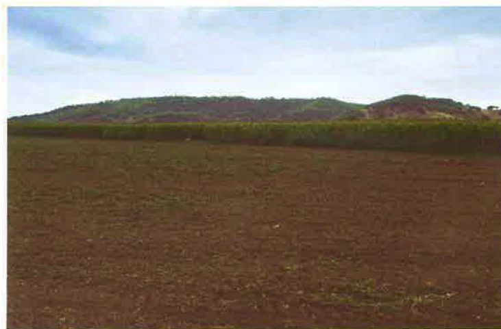
Figura 1 – O planalto dos Chões de Alpompe visto de Este

os espólios metálicos que cabem na categoria dos militaria , como é o caso dos projéteis de chumbo para funda (as chamadas glandes), alguns de produção local e que são muito abundantes no sítio (FABIÃO, PEREIRA e PIMENTA, 2014, pp. 114-129), compaginam-se com uma instalação militar, por um lado, e com a presença, no vale do Tejo, do general romano conhecido por Galaico, por outro. Também o talude, bem conservado e construído com terra, que rodeia, em grande parte, o planalto (ARRUDA et al. , no prelo) acentua o carácter militar do sítio. O numeroso conjunto numismático, constituído por mais de 150 exemplares (RUIVO, 1999), revela, igualmente "... um momento de introdução / difusão / uso de moeda romana no ocidente em cronologia compatível com a notícia de Estrabão..." (FABIÃO, 2014, p. 14).