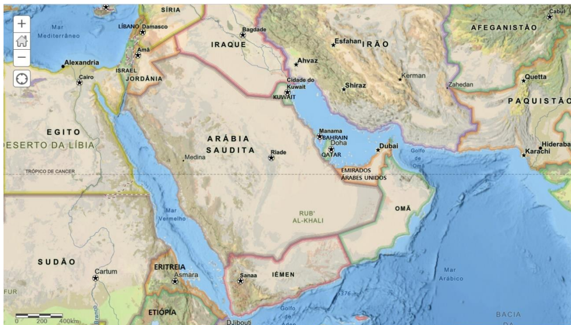
Anexo 2 – A região do Golfo Pérsico.