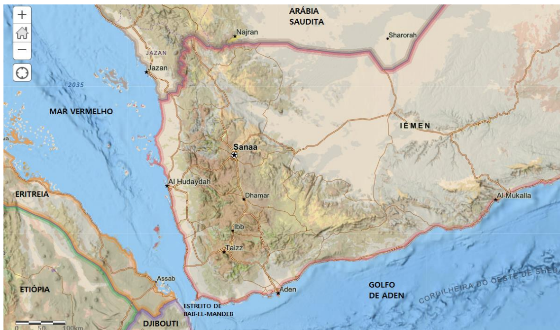
Anexo 3 – O Estreito de Bab-el-Mandeb.