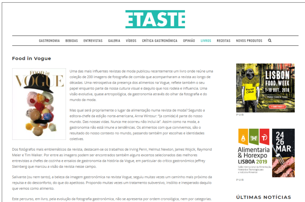
Figura 6. Visualização do artigo Food in Vogue