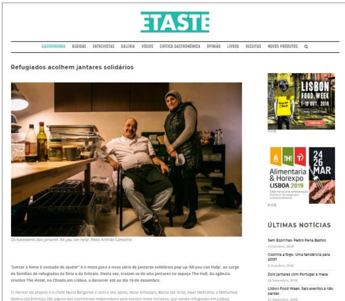
Figura 1. Visualização do artigo Refugiados acolhem jantares solidários.

Título: Refugiados acolhem jantares solidários