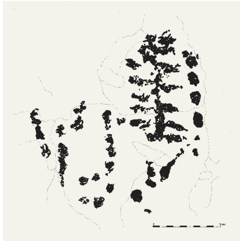
Fig. 7 Lapa dos Coelhos (Torres Novas) - ramiforme.