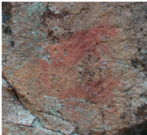
Fig. 2 Faia 1 (núcleo do Côa) - bovídeos.

As manifestações gráficas destas primeiras comunidades agro-pastoris apresentam clara ruptura com as figuras paleolíticas, resultado de uma alteração do sistema económico, social e climático. Relativamente à arte esquemática pintada, podemos preliminarmente definir duas fases: a arte esquemática semi-naturalista , com representações zoomórficas de grandes dimensões que evocam a imaginética paleolítica e onde a figura humana surge com os seus atributos formais definidos. Desta fase são exemplo a Faia no Vale do Côa (Fig. 2), alguns motivos da Lapa dos Gaivões (Arronches) e o Abrigo do Ribeiro das Casas (Malhada Sorda, Almeida). Neste último abrigo existia um grande equídeo semi-naturalista (Fig. 3), que apresentava a linha cervice-dorsal bem definida e mostrava sensação de movimento através da inclinação das patas. Cronologicamente trata-se de uma fase antiga do Neolítico (VI-V milénio a.C.). Estas representações semi-naturalistas correspondem assim à continuação do grande ciclo artístico paleolítico do Vale do Côa,