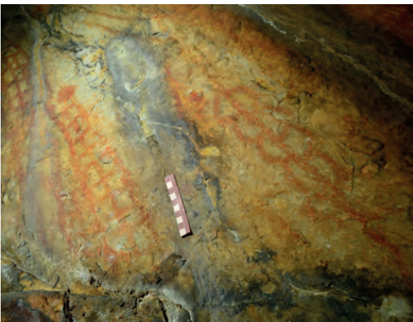
Fig. 6 Lapa dos Louções (Arronches) - painel 2.