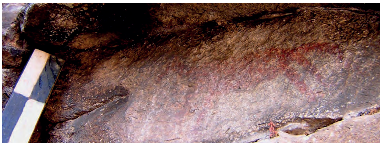
Fig. 3 Abrigo da Malhada Sorda (Almeida) - cavalo.

Com a consolidação do sistema agro-pastoril, surge a segunda fase: a da arte esquemática ideográfica . O modelo conceptual do território volta a alterar-se e com ele o subsistema simbólico, que alcança um elevado grau de esquematismo, transformando-se as representações em ideogramas. A figura humana perde os seus atributos formais, surgindo isolada sem referências espaciais, e os motivos abstractos tornam-se preponderantes. Desta segunda fase, são exemplos o Abrigo Pinho Monteiro (Fig. 4), alguns painéis da Lapa dos Gaivões (Fig. 5), a Lapa dos Louções (Fig. 6) e a Igreja dos Mouros, a segunda fase do Abrigo do Ribeiro das Casas (painel inferior que apresenta duas figuras antropomórficas), o ramiforme da Lapa dos Coelhoos (Fig. 7), os antropomorfos do Abrigo do Lapedo e os motivos esquemáticos do Pego da Rainha. Esta fase terá início em finais do V milénio a.C., prolongando-se até ao III milénio a.C., acompanhando assim as transformações efectuadas entre o final do Neolítico e o início do período Calcolítico.