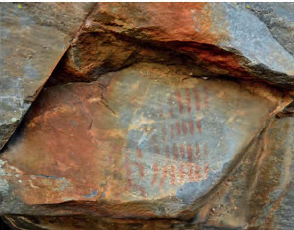
Fig. 5 Lapa dos Gaivões (Arronches) - painel 6.