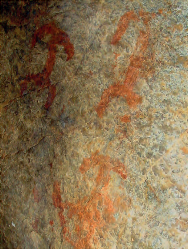
Fig. 4 Abrigo Pinho Monteiro (Arronches) - antropomorfos.