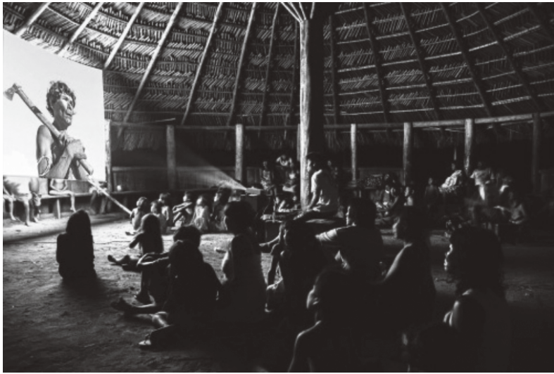
Figura 1 · Reprodução/ Vídeo nas Aldeias. Fonte: www.3.bp.blogspot.com/-9orcAKcAaX8/UUOQMucKcFkl/AAAAAAAAAZM/Q5JMfktkfAc/s1600/video+nas+aldeias.jpg