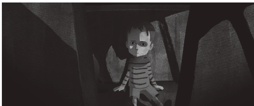
Figura 4 · Estilhaços . Still da lembrança do pai, ao contar ao filho o que realmente aconteceu. Fonte: https://www.pracafilmes.pt/

Figura 5 · Estilhaços . Still da lembrança do pai, ao contar ao filho o que realmente aconteceu. Fonte: https://www.pracafilmes.pt/