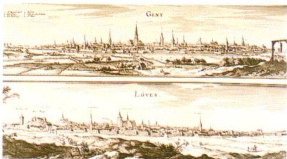
Gand e Lovaina (gravuras de Matthaeus Merian, séc. XVII).

Observamos as dificuldades crescentes do Erário régio e a queda gradual do movimento da feitoria portuguesa na Flandres, centro por excelência distribuidor das nossas mercadorias e de ligação com a Europa, inclusivamente do ponto de vista político, que acabaremos por encerrar em 1549. Este afastamento do Norte da Europa, reforçado sucessivamente durante o reinado de D. João III por uma política de desinteresse pelas potências europeias rivais da Espanha é, aliás, encarado como posição «insuficiente e lacunar» por Borges de Macedo.