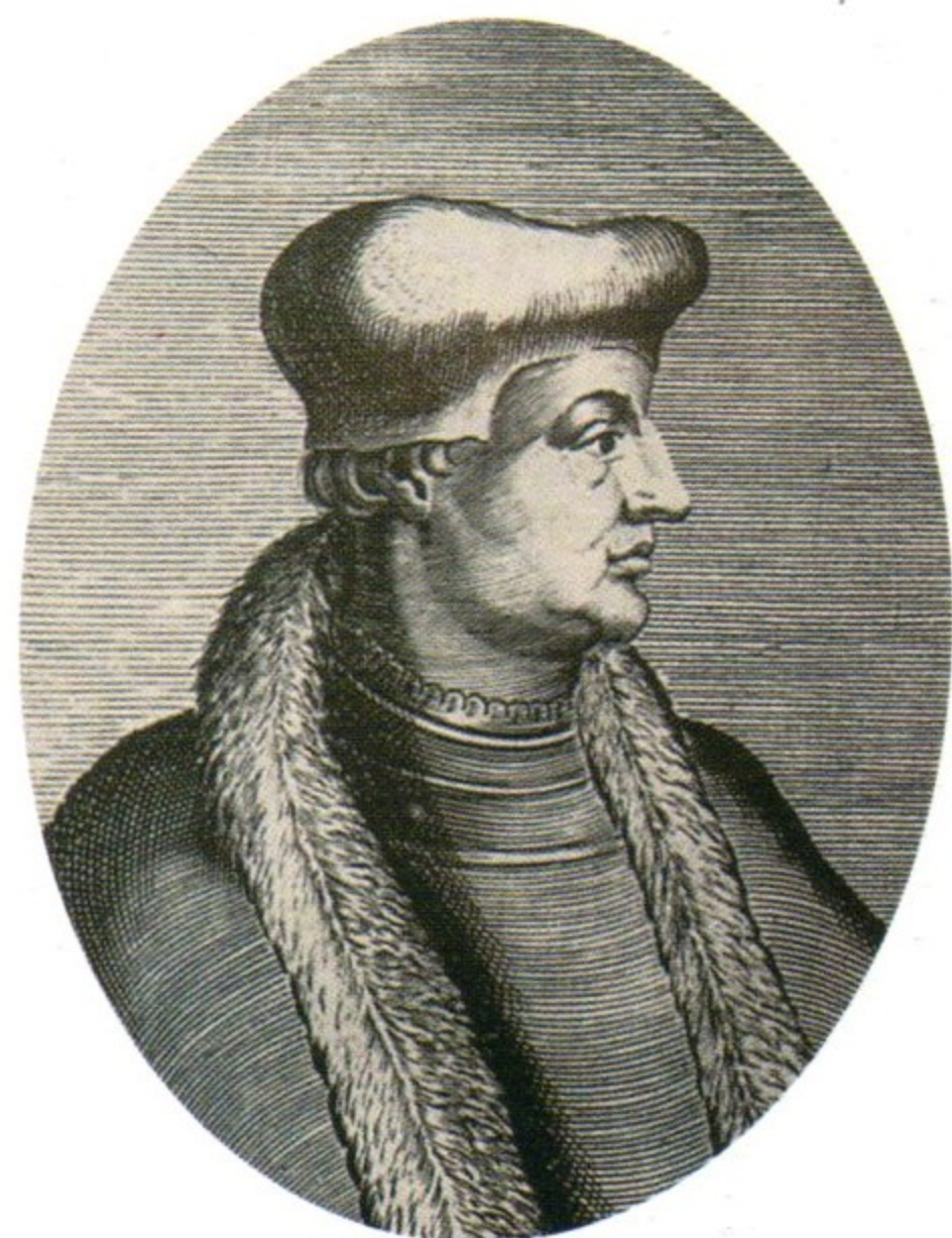
Nicolau Clenardo (1495-1542), humanista flamengo que em 1538 veio para Portugal a convite de D. João III.

É certo que se vai verificando uma incapacidade material de manter com êxito as diversas linhas da Expansão portuguesa, atribuível, porventura entre outros factores, ao mau aproveitamento dos recursos obtidos nesse processo (principalmente, segundo alguns autores, o não se ter desenvolvido o sistema produtivo metropolitano). Contudo há a tornar tudo isso mais grave uma conjuntura marcada por crises mundiais (Magalhães Godinho fixa-as em 1521-24, 1531-35 e 1545-52), que atingirão Portugal, agravando-se os sintomas, particularmente em meados do século.