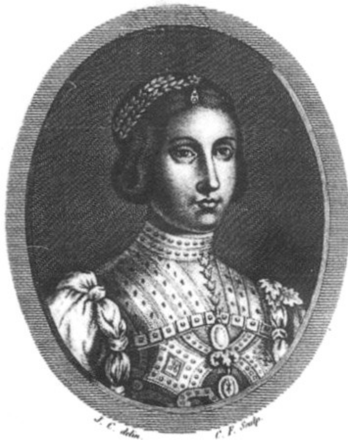
D. ISABEL, INFANTA, FILHA D' ELREI D. MANOEL, IMPERATRIZ D' ALEMANHA.

D. Isabel, filha de D. Manuel I e mulher de Carlos V (REVD).