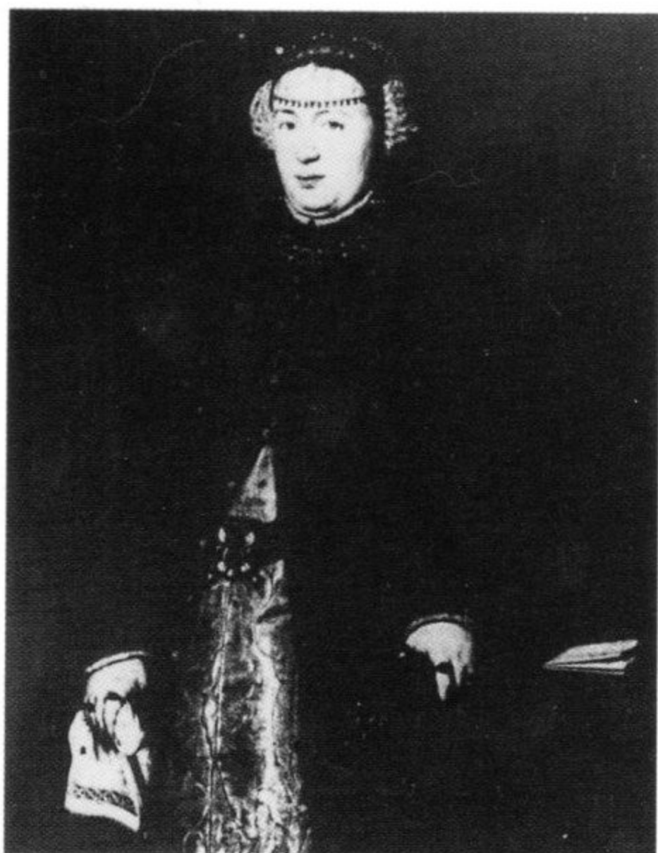
Rainha D. Catarina, mulher de D. João III (retrato a óleo de António Moro do Museu do Prado; BNL).