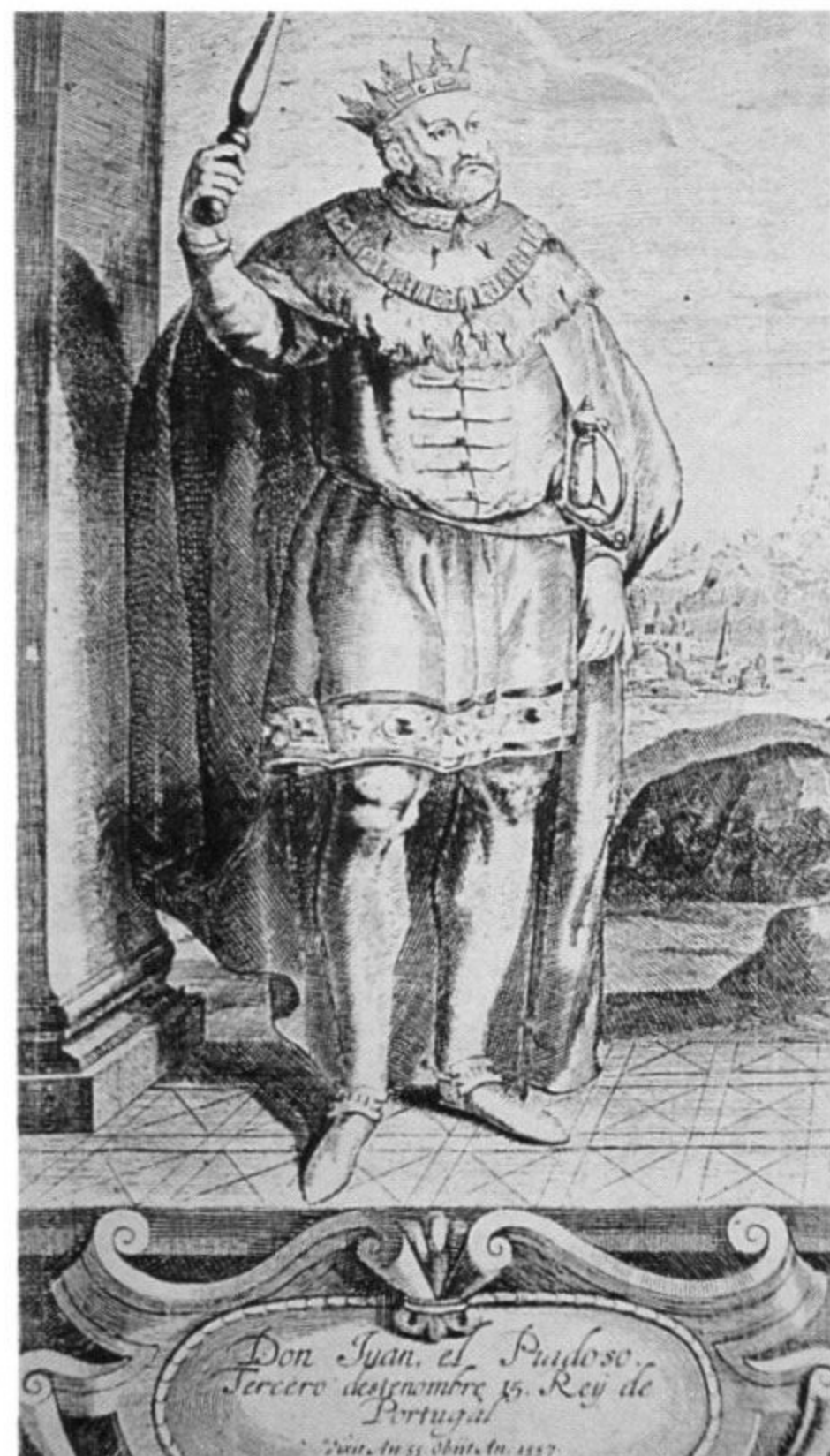
D. João III (HRP, 1730).

Antes de mais, numa época de intensos conflitos internacionais na Europa, que posição assume D. João III? Face ao conflito entre as forças imperiais e a França — em várias frentes, particularmente em território italiano, envolvendo diversos Estados, o próprio Papado e os Turcos — procura manter uma atitude neutral e até mesmo conciliatória. Lutava-se então pela definição da hegemonia no Mediterrâneo e as solicitações a Portugal de ambas as partes requeriam um sopesar dos diversos interesses e vantagens em jogo.