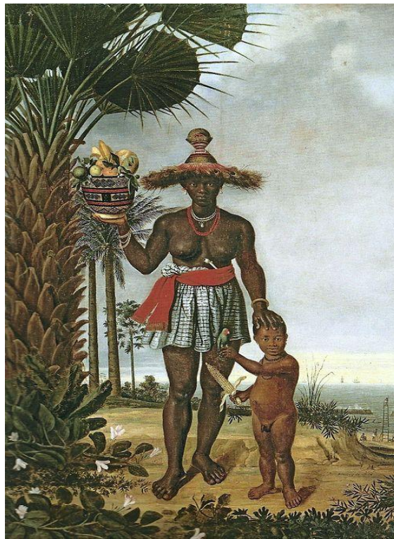
Figura 2 Retrato de uma Mulher Bantu e Seu Filho no Recife

alimentariam o sincretismo afro-brasileiro; Islamizadas (hauçás, malês), com práticas que oscilavam entre ortodoxia e adaptação (Reis, 2003); Bantos (Congo-Angola), 70% do total, cuja influência moldaria desde a língua até a cultura material. (Curtin, 1969) Essa complexidade étnica inicial seria crucial para a formação das identidades crioulas no período colonial.