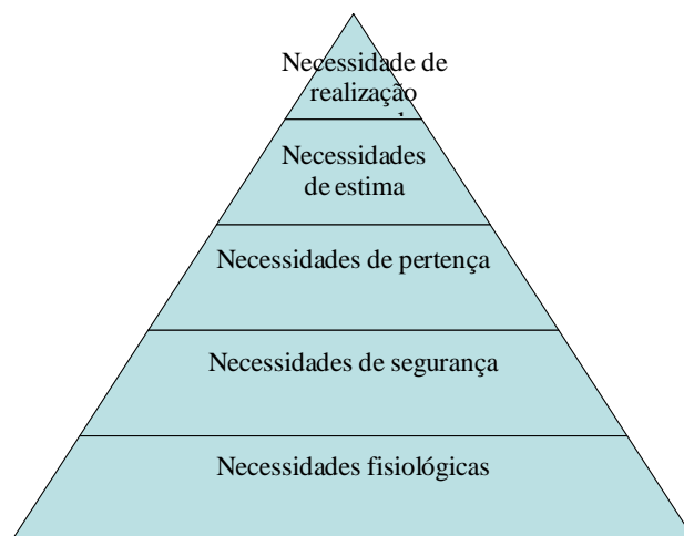
Figura 1 – Hierarquia das Necessidades, segundo Maslow

As necessidades fisiológicas e as de segurança centram-se no indivíduo ao nível mais elementar da sobrevivência e terão de ser satisfeitas para não provocarem a desagregação do sujeito. São as necessidades a que muitos autores chamam de autênticas ou fundamentais. Contudo, uma vez satisfeitas aparecem as primeiras necessidades sociais. É aqui que nos podemos referir às necessidades específicas dos sujeitos onde estes lutam para alcançar a extensão total da sua capacidade que procura a sua fórmula própria de realização. Estas necessidades surgem em contextos concretos, exteriores ao sujeito, comuns a vários sujeitos ou estritamente individuais.