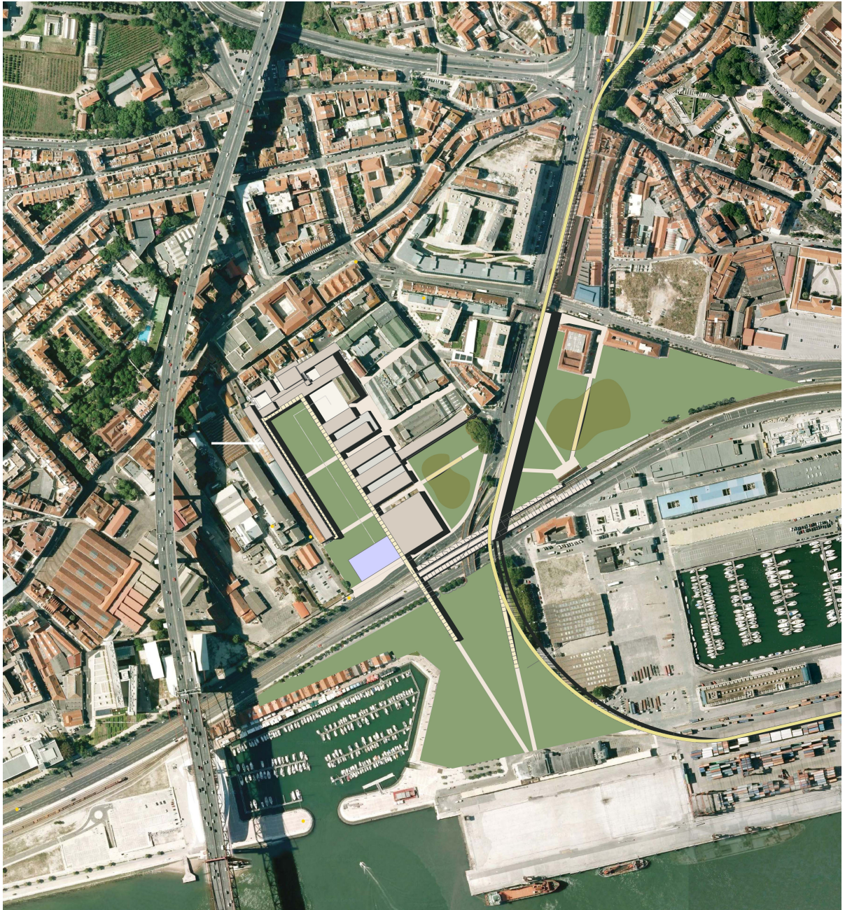
Figura 1. Ortofotomapa. Plano Urbano