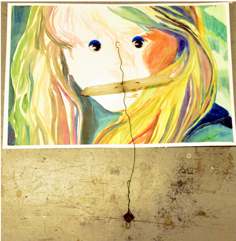
INSTALAÇÃO SOBRE PINTURA DE CECÍLIA CORUJO - COLEGA DE ATELIER