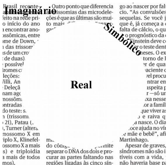
DIAGRAMA DO REGISTO REAL-SIMBÓLICO-IMAGINÁRIO