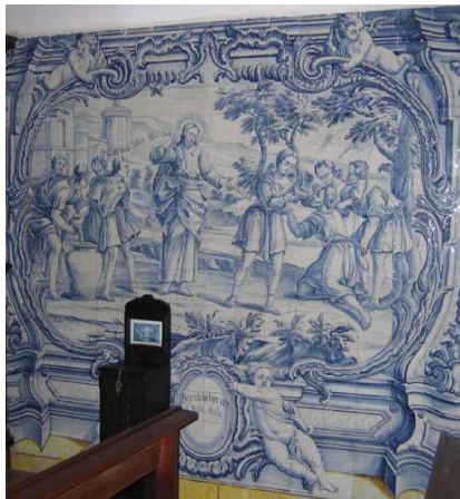
Fig. 235 - Dar de beber aos que tem sede

Dar de comer aos que tem fome revela um cenário de montanhas e cidade, com vários edifícios à direita. À esquerda, várias figuras masculinas, talvez os discípulos (que certamente traziam o pão, mas o painel está cortado), e à