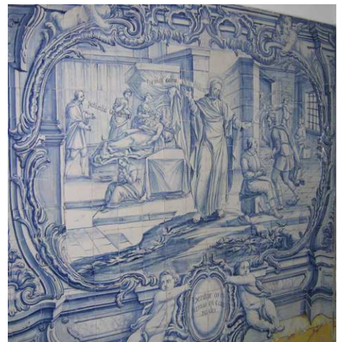
Fig. 237 - Visitar os enfermos e encarcerados