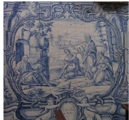
Fig. 229 - Consolar os tristes

A representação seguinte exhibe a ressurreição de Lázaro para ilustrar a obra consolar os tristes , pretendendo-se destacar não tanto o milagre mas sim o facto de Jesus ter consolado as duas irmãs. Na verdade, o painel concentra vários passos deste episódio. Ao saber que Jesus acabara de chegar, Marta correu ao Seu encontro, dizendo-lhe o que corresponde ao versículo 21, do capítulo 11, do Evangelho de São João – Domine si fuisses hic frater meus non fuisset mortuus / Senhor, se Tu cá estivesses, o meu irmão não teria morrido . Jesus respondeu-lhe: Resurget frater tuus / Teu irmão ressuscitará . A presença de Marta na mesma cena relaciona-se com um passo mais à frente, pois Cristo mandou chamá-la, mantendo-se no mesmo local. Ao chegar, Maria pronunciou as mesmas palavras de sua irmã. A representação da esquerda ilustra os versículos seguintes, embora Jesus não esteja junto à gruta fechada com uma pedra, onde Lázaro estava sepultado. Este surge, envolto por ligaduras, mas é ajudado por uma figura masculina, muito possivelmente um dos judeus que acompanhou Maria ao local do encontro com Jesus.