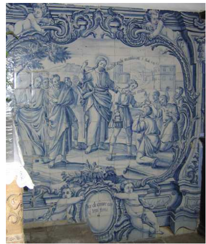
Fig. 234 - Dar de comer aos que tem fome

A representação alusiva a vezitar os enfermos e encarcerados , revela dois ambientes: o da esquerda é o interior de um quarto, onde um homem está deitado numa cama, de dossel quadrado. Apoiado em almofadas, prepara-se para receber a refeição que lhe