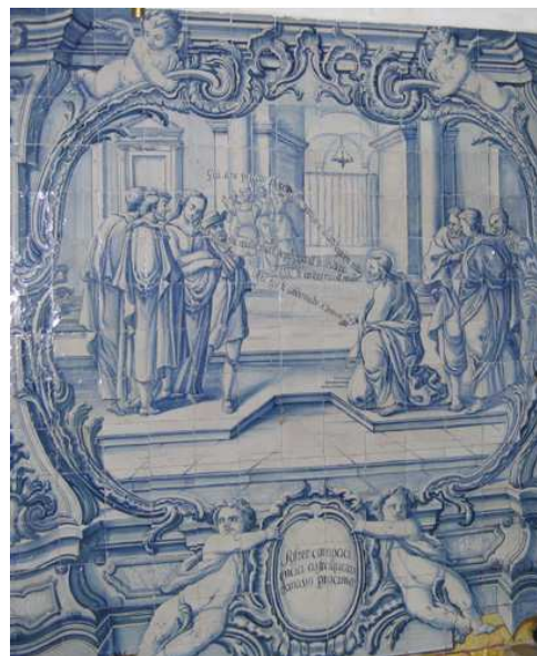
Fig. 232 - Sofrer com paciência as fraquezas do nosso próximo

O episódio da mulher adúltera, que aqui se encontra representado para ilustrar sofrer com paciência as fraquezas do nosso próximo , segue com fidelidade o Evangelho em que se baseia. De acordo com São João, ao regressar ao templo para ensinar, os Doutores da Lei e os fariseus levaram a Jesus uma mulher que acusavam de adultério. O cenário é uma arquitectura de linguagem clássica, com uma abóbada de cruzaria de ogivas ao fundo. A mulher, rodeada pelos seus detractores, encontra-se à esquerda, e o mais baixo dos três homens é o que pronuncia a acusação: Moc mulier modo de prehensa est in adulterio / Mestre, esta mulher foi apanhada em flagrante adultério (Jo 8, 4). Continuando a seguir o Evangelho, estes homens desafiaram Jesus recordando-lhe que Moisés mandava matar à pedrada tais mulheres. Inclinando-se, Jesus começou a escrever na terra, tal como aqui podemos observar, mas à insistência