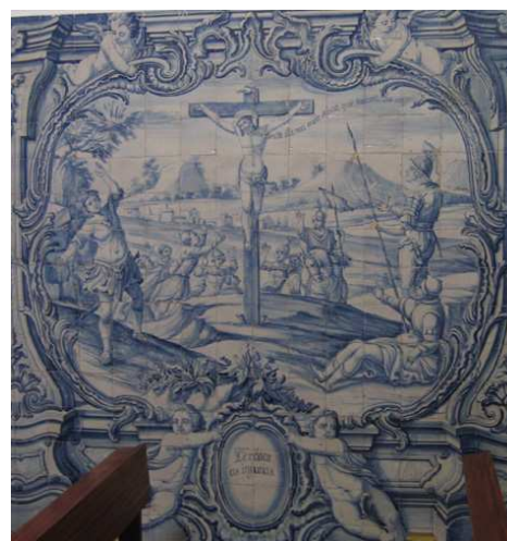
Fig. 231 - Perdoar as injúrias

Segue-se o Calvário numa composição determinada pela imagem de Cristo crucificado que evoca o perdão das injúrias . Do lado esquerdo e em primeiro plano, observa-se uma figura masculina agitada, que corresponde, do lado oposto, a dois soldados, um sentado e outro em pé, certamente os que, de acordo com o Evangelho, escarneciam de Jesus. Atrás, aproximam-se várias pessoas que seguiram Jesus e se lamentavam por Ele, e um soldado a cavalo. Ao fundo, a paisagem é pontuada por casas, vegetação e, mais longe, colinas e montanhas. Cristo pronuncia a sua oração, no momento da morte, correspondente não apenas à sua consciência filial, mas também à sua missão de misericórdia: Pater dimitte illis, non enim sciunt, quid faciunt Luc cap. 23 v. 34 / Perdoa-lhes Pai, porque não sabem o que fazem.