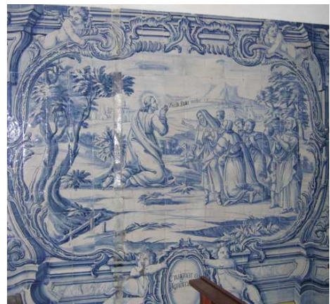
Fig. 228 - Ensinar os ignorantes

Ensinar os ignorantes evoca Jesus a ensinar o Pai Nosso a homens, mulheres e crianças, numa paisagem isolada, onde apenas se vislumbram algumas casas, ao longe. O pedido veio do homem de joelhos, um dos discípulos - Domine, doce nos orare / Senhor, ensina-nos a orar . Jesus replicou “quando orardes dizei: Pai, santificado seja o teu nome, venha o teu Reino ”, ou seja, Dicite Pater noster S. Lucas cap. 11 v. 1º et 2º .