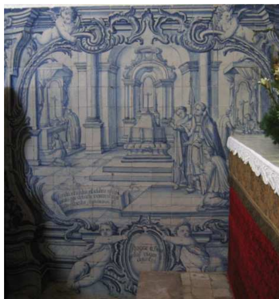
Fig. 233 - Rogar a Deus pelos vivos e pelos defuntos

Por fim, rogar a Deus pelos vivos e pelos defuntos , revela o interior de uma igreja, com três altares. Nos dois laterais, com uma espécie de dossel preso do lados, retábulo de remate semicircular, flanqueado por duas velas, e uma cruz sobre o altar, um padre é acompanhado por um acólito. No da esquerda, este último está de joelhos, e o padre segura um missal, enquanto à direita o acólito ajuda o padre, segurando as galhetas e despejando uma delas para o cálice que o padre ergue. Ou seja, ambos rezam uma