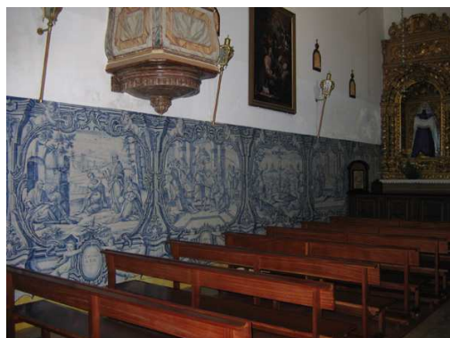
Fig. 225 - Perspectiva do interior do templo

São muito reduzidas as informações referentes à construção da igreja, sabendo-se apenas que estava concluída no final do século XVI, pois antes de 1601 já aí havia sido instituída a Irmandade do Senhor dos Passos 4 . A sua configuração corresponde ao templo que ainda hoje existe, apesar dos danos provocados pelo Terramoto de 1755. Trata-se de uma igreja de