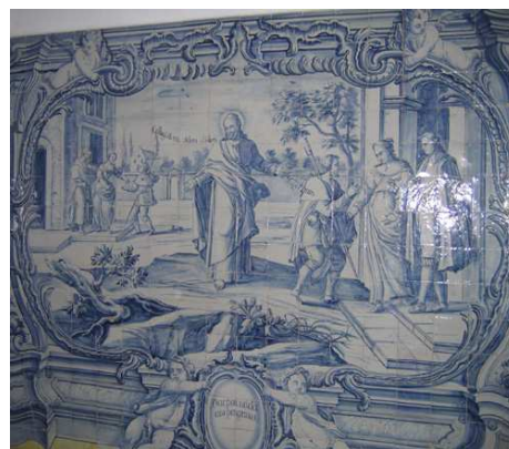
Fig. 238 - Dar poussada aos peregrinos

Dar poussada (sic) aos peregrinos (sic) exhibe duas situações semelhantes de peregrinos a serem acolhidos em duas casas, divididas pela figura de Cristo que repete o versículo de São Mateus – Hospes eram / era peregrino – e – Collegistime Idem ibidem / e recolheste-me . Ambos os viajantes que se encontram à porta das casas são peregrinos de Santiago, bem identificados pela capa com a vieira, o chapéu, o bordão e a bolsa à cintura. O fundo é limitado por um muro, apenas aberto por uma porta ladeada por pilastras e rematada por frontão triangular, para lá do qual há árvores e casas.