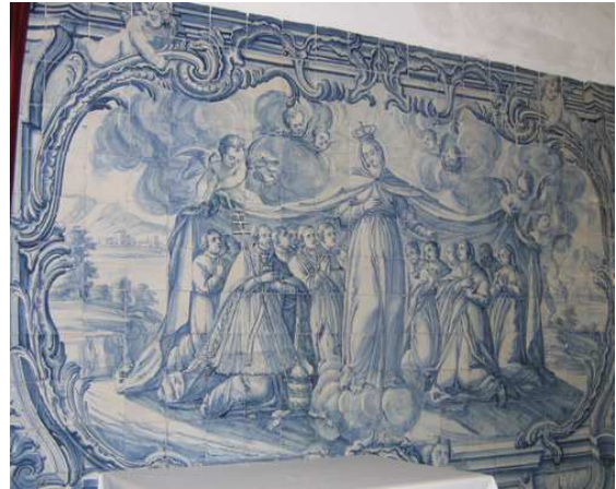
Fig. 241 - Virgem do Manto

A primeira não obedece às disposições impostas pelo decreto real de 1627 para a representação desta iconografia nas bandeiras das Irmandades, pelo que cremos tratar-se de um Virgem do Manto . Nossa Senhora, coroada e com o amplo manto aberto por anjos, abriga à esquerda um Papa, com a tiara no chão e uma outra figura eclesiástica, certamente um bispo. Os restantes rostos devem corresponder a religiosos.