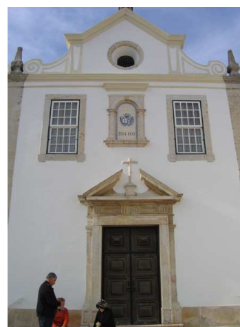
Fig. 226 - Fachada principal

Os danos provocados pelo Terramoto não foram, no entanto, tão gravosos como os que atingiram a igreja matriz, uma vez que enquanto se procedia à sua reparação, esta ficou sediada na Misericórdia 7 . Em 1758, as Memórias Paroquiais revelam um panorama pouco animador, traçando um percurso de declínio da Misericórdia: anteriormente com uma actividade assistencial reconhecida e depois de receber um legado de mais de cinquenta mil cruzados “(...) está empenhada, nem tem cousa alguma, de sorte que para se enterrarem os