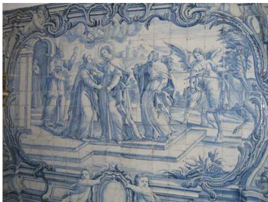
Fig. 242 - Visitação

Do lado oposto, as mulheres ocupam o primeiro plano, com a rainha mais próxima de Nossa Senhora e com uma coroa por terra, em paralelo com a tiara, ainda que de desenho fruste. Entre os restantes rostos distingue-se o de um homem. A divisão social não é tão evidente neste quadro como noutros onde há religiosos de várias ordens e no plano civil há nobres de trajes luxuosos, atrás do rei e da rainha. Parece observar-se aqui uma simplificação do tema que tem por fundo uma paisagem, mas onde o céu está pleno de nuvens e querubins, como se o céu tivesse descido à terra, numa solução muito barroca.