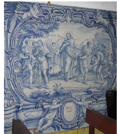
Fig. 236 - Vestir os nus