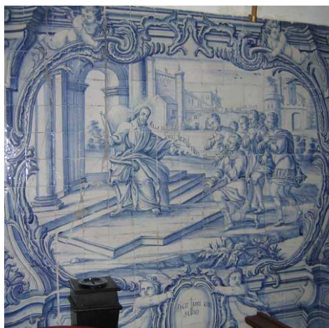
Fig. 227 - Dar bom conselho

As sete obras espirituais , sobrevalorizadas em relação às corporais, encontram-se naturalmente do lado do Evangelho, apresentando uma configuração interna mais complexa.