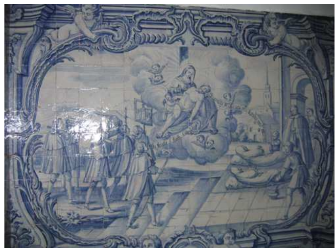
Fig. 240 - Enterrar os mortos

Por fim, enterrar os mortos , prolonga o sentido da obra anterior, comungando da maior complexidade compositiva relativamente às primeiras obras corporais . A imagem central já não é Cristo, mas sim uma Pietà , envolta por nuvens e querubins, dividindo a composição no que parecem ser dois géneros de enterros. É a dor de Maria, com o filho morto nos braços, que surge num plano etéreo e que tem correspondência com a bandeira à frente do cortejo fúnebre, onde a face visível ao observador é a imagem de Nossa Senhora da Misericórdia.