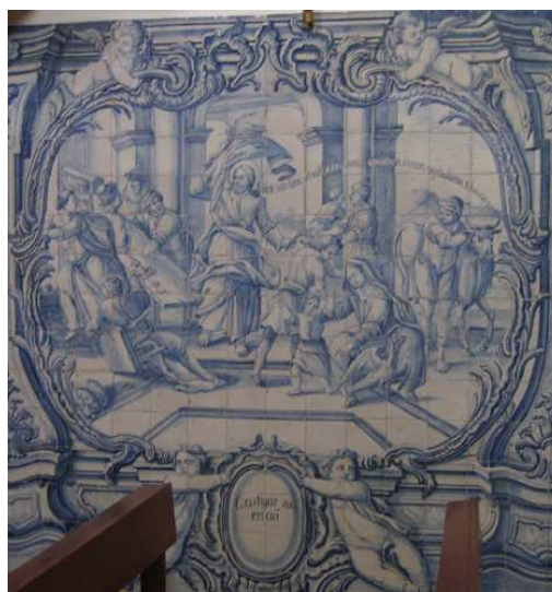
Fig. 230 - Castigar os que erram

Em castigar os que erram o episódio escolhido foi a expulsão dos vendilhões do templo. Neste espaço, com colunas, pilastras e arcos de linguagem clássica, Jesus domina a composição ao erguer o chicote de cordas para expulsar os vendilhões, ao mesmo tempo que pronuncia o versículo Jo 2, 16 – Auferte ista hinc, esnolite facere domum Patris mei, domum negotiationis S. Joan Cap. 2 v. 16 / Tirai isso daqui. Não façais da Casa de meu Pai uma feira.