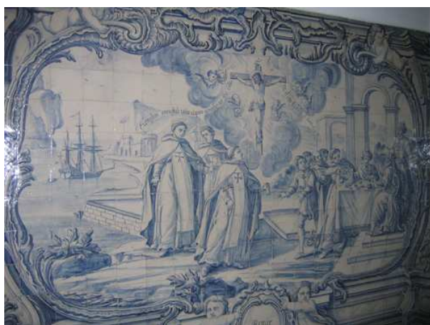
Fig. 239 - Remir os cativos

Em remir os cativos , a figura de Cristo, ao centro, é substituída pela imagem da Sua Crucificação, envolta por nuvens e cuja função não é separar as cenas, mas conferir-lhe um novo significado. Na verdade, neste painel observa-se um resgate de cativos, por parte dos frades da Santíssima Trindade, bem identificados pelo manto e pela cruz gravada ao peito. São três (o primeiro dos quais com uma bolsa com dinheiro na mão) os que surgem ao centro da composição e em