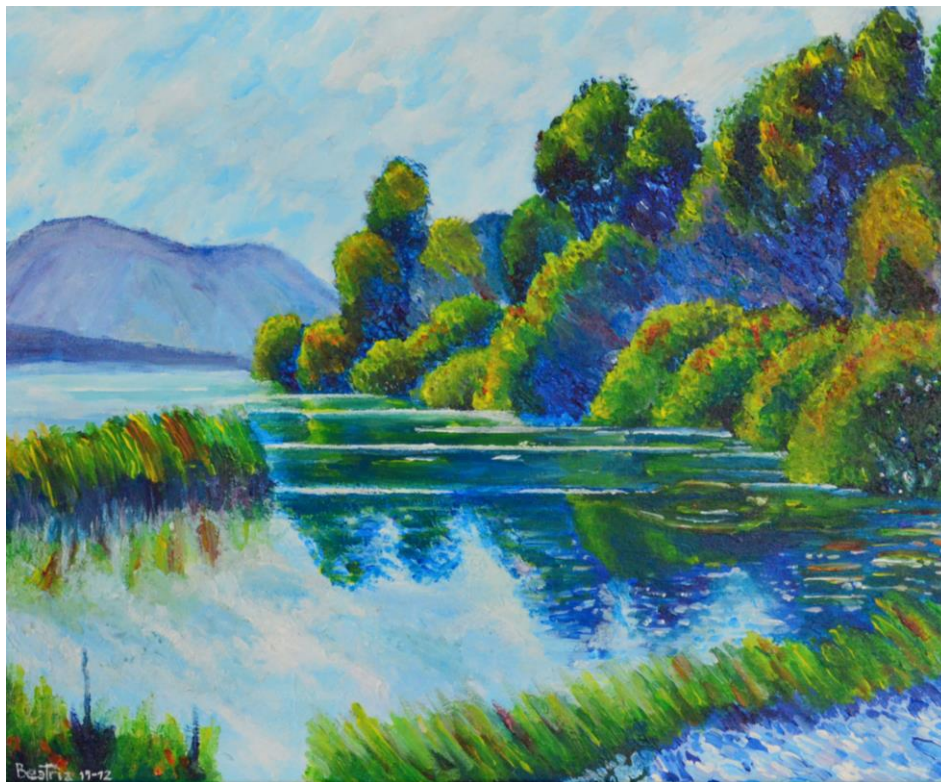
Figuras 5 a 12 - Resultados de alguns dos alunos (topo, acrílico sobre tela, dimensões variáveis) face à imagem de referência (a baixo, gerada por AI)