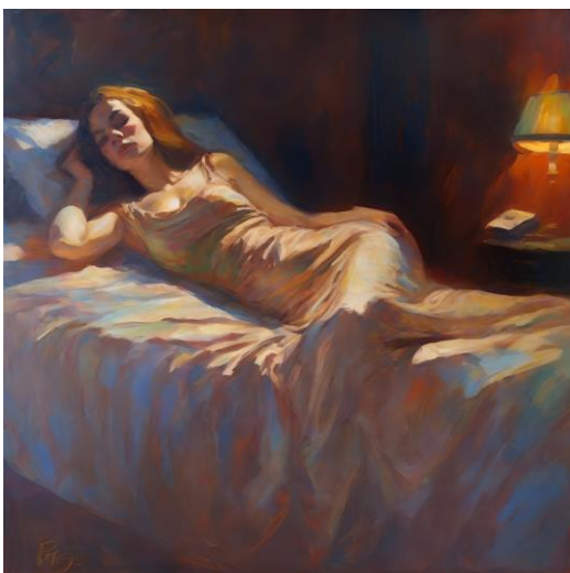
Figura 1 a 4 – Retrato de mulher deitada numa cama, pintura a óleo, mistério, ambiente renascentista, cores dramáticas, HD, paleta de cores rica, romantismo, clássico

Num modelo capaz de gerar imagens a partir de texto, pode ser definindo um prompt aleatório e obter um resultado adequado. No entanto, o potencial está na correspondência a estilos e temas específicos. Em breves segundos, os resultados obtidos, reestruturam os padrões da sua base de dados, para originar algo que vá ao encontro do pedido. Algumas das respostas são altamente controversas, por se assemelharem bastante a obras de outros artistas. Consoante a forma como foi escrito e elaborado o prompt , a imagem pode evocar e imitar padrões de obras como Olympia de Manet ou Vénus Adormecida de Giorgione, caso estas existam na base de aprendizagem do programa.