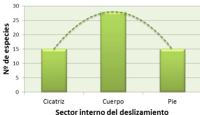
Gráfico 2. Riqueza florística p/ sector interno de los deslizamientos (valor promedio).

Por lo que a los impactos de los deslizamientos en la biodiversidad se refiere, cada sector interno con sus características particulares presenta valores diferenciados entre sí (Gráfico 2). Por supuesto, esta variación en el número de especies no es aleatoria. Connell (1978) ya afirmó con la hipótesis de perturbación intermedia que el máximo de riqueza florística tiene lugar en el grado intermedio de la perturbación. De igual modo, el cuerpo, con presencia de nutrientes y suelo disponible, todavía sin las cantidades acumuladas en el sector de pie, que hacen que sea colonizado, como se ha visto anteriormente, por etapas avanzadas. Sin embargo, en este sector intermedio confluyen varias especies pertenecientes a diversos niveles de la sucesión vegetal, y de este modo culminando en valores superiores a los demás. Los valores de cicatriz y pie son similares a los valores registrados en las áreas adyacentes, con 15 especies de promedio por inventario.