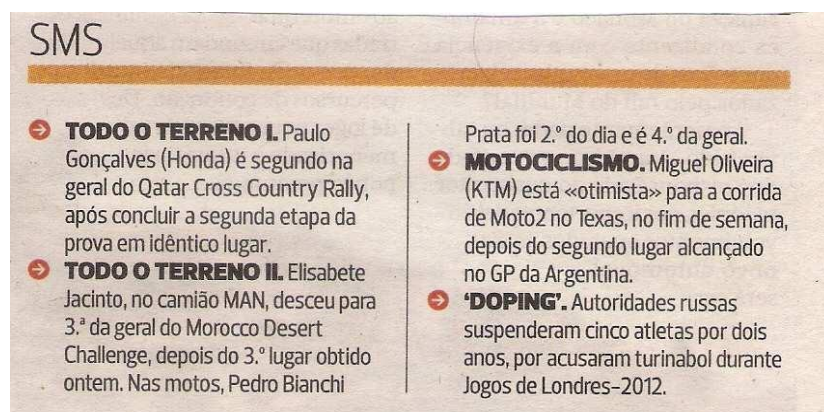
Figura 2 Notícia SMS - Jornal A Bola 24 de abril