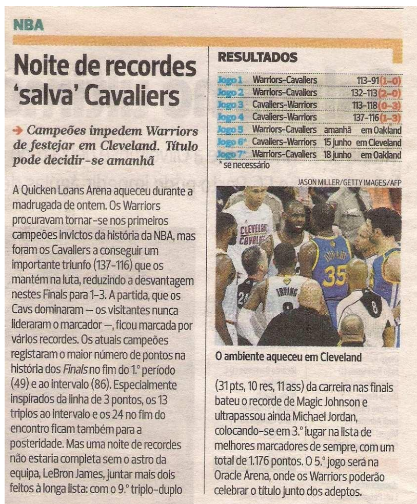
Figura 4 Notícia Individual - Jornal A Bola 11 de junho