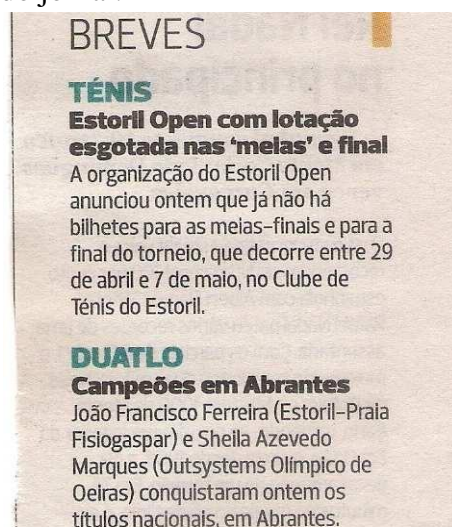
Figura 3 Notícia Breves - Jornal A Bola 24 de abril