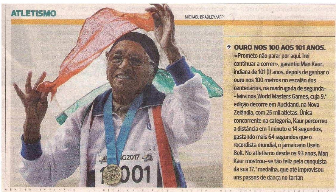
Figura 5 Notícia Foto-legenda - Jornal A Bola 25 de abril