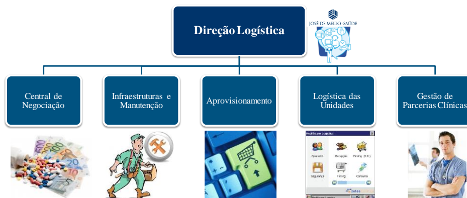
Figura 1 – Direção Logística da JMS

A Direção Logística da JMS, sob responsabilidade de um diretor, é composta por diversas áreas; cada uma destas tem diretor atribuído, conforme Figura 1: