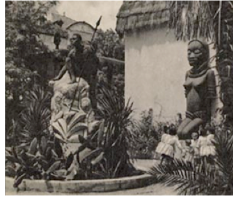
Figura 18: Pavilhão da Guiné e escultura de africano, anos 40 do século XX, fotografia do espólio da FBB.