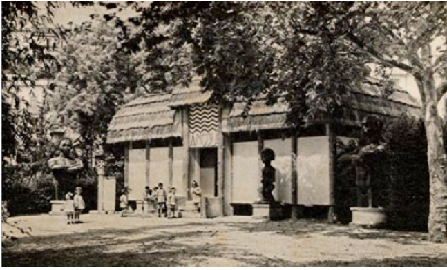
Figura 6: Pavilhão original de Angola, anos 40 do século XX, fotografia do espólio da FBB.