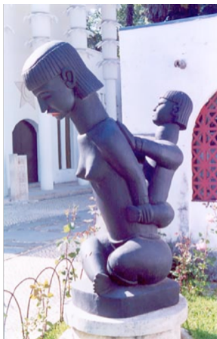
Figura 26: Escultura representativa da "maternidade", fotografia da autora.