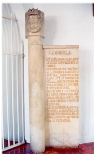
Figura 13: Padrão de Angola, fotografia da autora.