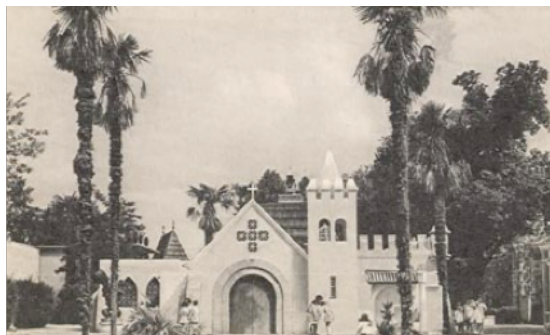
Figuras 11 e 12: Capela das Missões – parte frontal e parte posterior, anos 40 do século XX, fotografias do espólio da FBB.