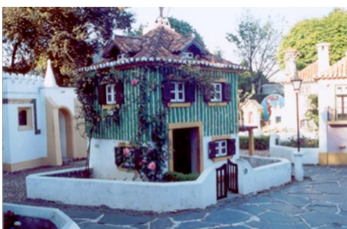
Figura 15: Miniaturizações de casas do país, fotografia da autora.