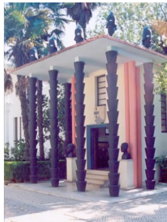
Figura 20: Pavilhão de S. Tomé e Príncipe