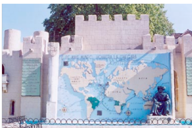
Figura 5: Planisfério das rotas marítimas.