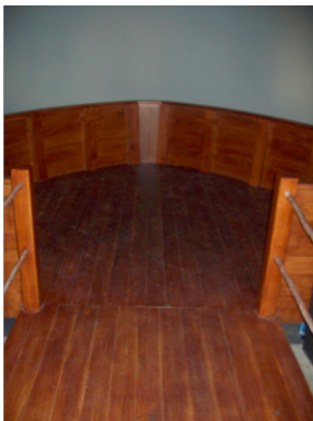
Figura 10: Interior actual do Pavilhão do Brasil, fotografia da autora.