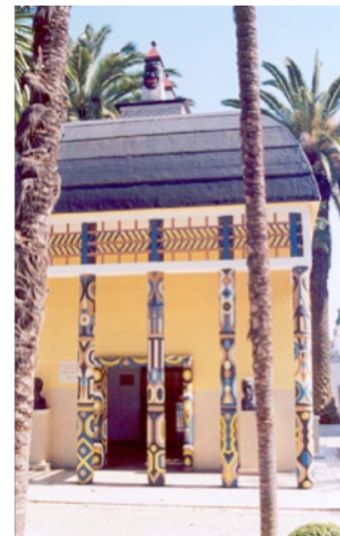
Figura 21: Pavilhão da Guiné-Bissau.