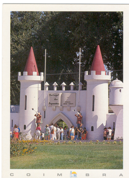
Figura 2: Entrada do PP, postal, sem data.