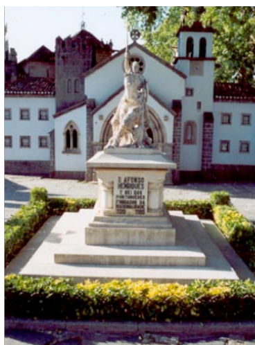
Figura 14: Estátua de Afonso Henriques, fotografia da autora.