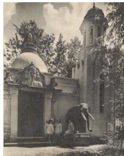
Figura 23: Pavilhão da Índia, anos 40 do século XX.