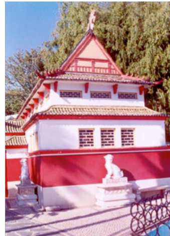
Figura 25: Pavilhão de Macau, fotografia da autora.