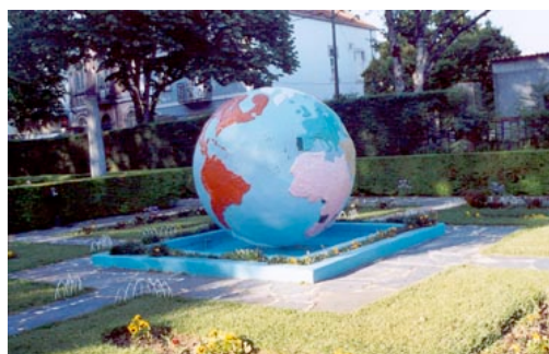
Figura 16: Globo terrestre com rotas marítimas dos portugueses.