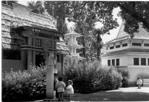
Figura 24: Pavilhão de Timor, anos 40 do século XX, fotografia do espólio da FBB.