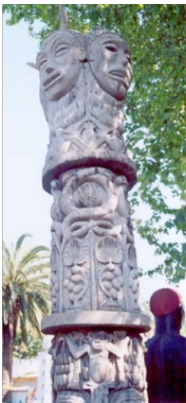
Figura 19: Coluna de pedra do largo da entrada do "Portugal de Além-Mar".