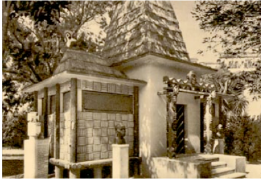
Figura 17: Pavilhão de Cab Verde, anos 40 do século XX.