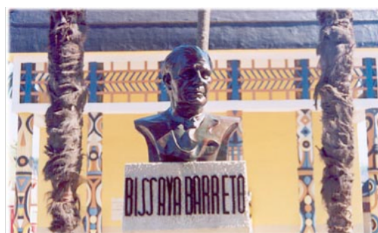
Figura 1: Busto do fundador do PP, fotografia da autora.