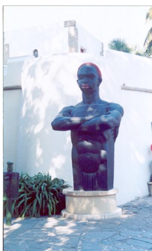
Figura 4: Figura de um africano na praça de entrada do "Portugal de Além-Mar".