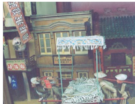
Figura 7, 8 e 9: Objectos no interior dos pavilhões.