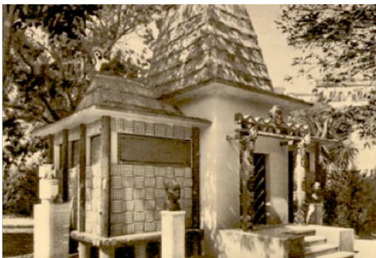
Figura 22: Pavilhão de Cabo Verde, anos 40 do século XX, fotografia do espólio da FBB.