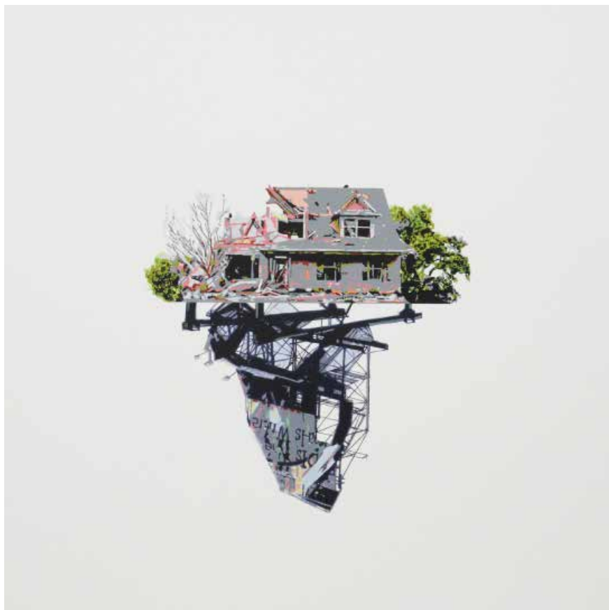
Figura 1 - Gabriel e Gilberto Colaço, 2016, Alinhamento 7, acrílico sobre papel, 50 x 50cm.