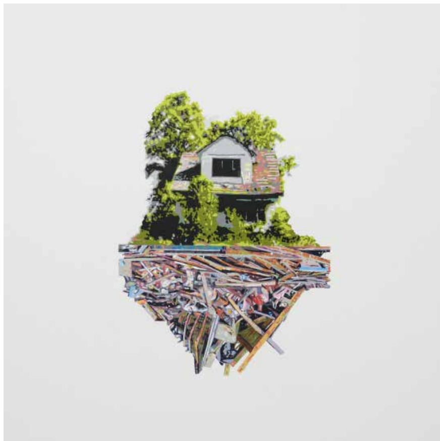
Figura 3 - Gabriel e Gilberto Colação 2016, Alinhamento 8, acrílico sobre papel, 50 x 50cm.