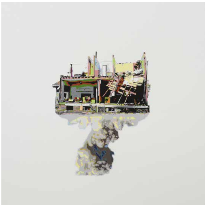
Figura 4 - Gabriel e Gilberto Colação , 2016, Alinhamento 9, acrílico sobre papel, 50 x 50cm.