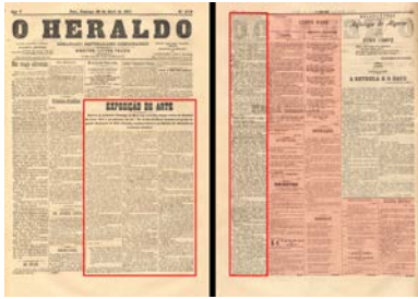
Figura 4. O Herald , 29 de abril de 1917, destacando-se as notícias de exposição e a secção Futurismo – Gente Nova .