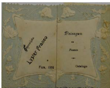
Figura 1. Capa do catálogo da Exposição Lyster Franco. Paisagem au Fusain. Faro, 1908.