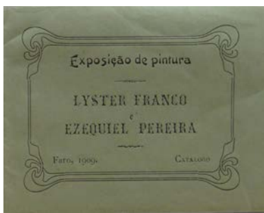
Figura 2. Capa do catálogo da Exposição de pintura. Lyster Franco e Ezequiel Pereira. Faro, 1909.