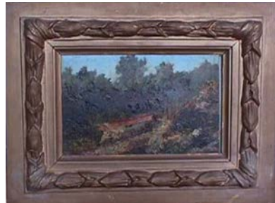
Figura 8. Carlos Lyster Franco. Cortelho do Braz . Óleo sobre tela.