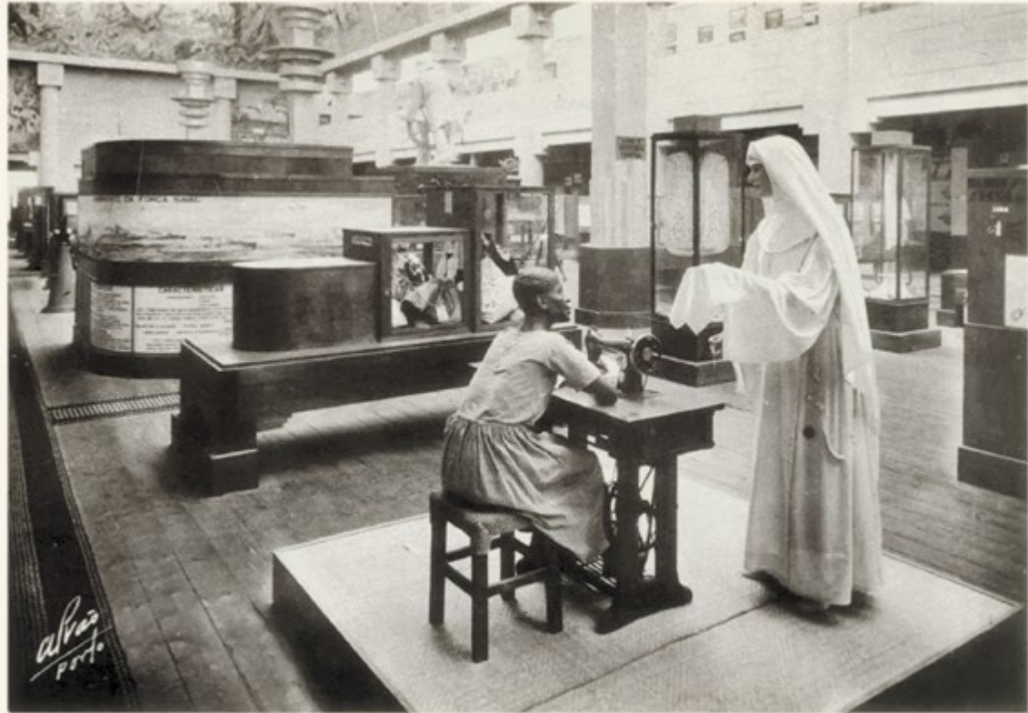
PALÁCIO DAS COLÓNIAS