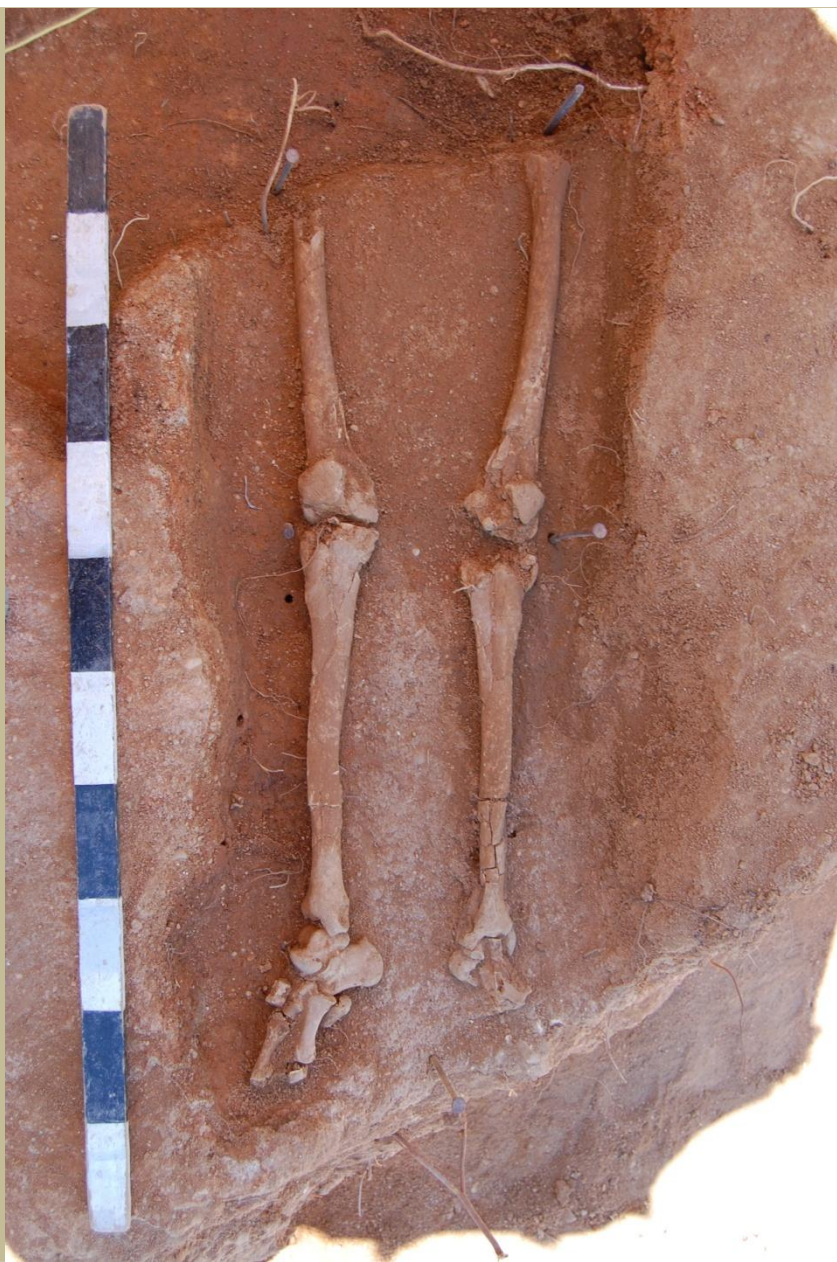
Fig. 6.— Inumação primária [1304]