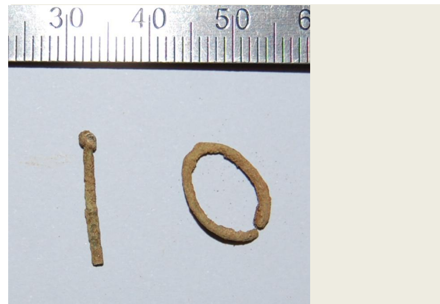
Figs. 8 e 9.— Espólio funerário associado à inumação primária [1313]