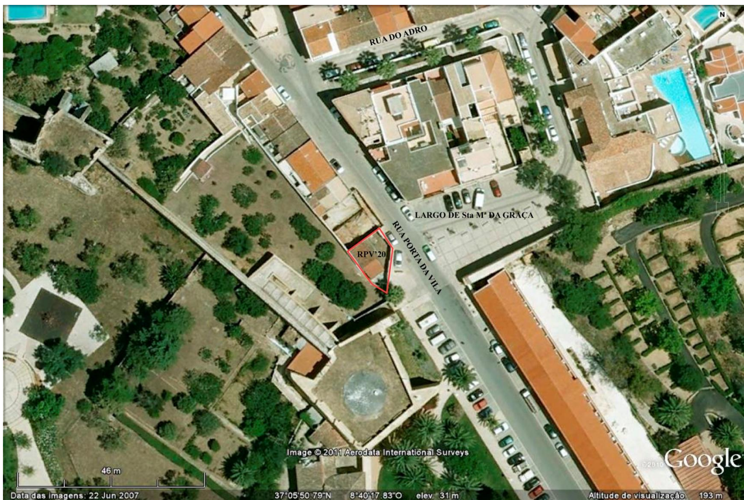
Fig. 3. — Localização da área de escavação: Rua Porta da Vila, 20

foram identificados 56 enterramentos, a maioria em fossas escavadas no geológico, de tipologia oval, antropomórfica e pseudo-rectangular, com uma orientação dominante coincidente com o eixo maior daquele templo (Oeste-Este) (Díaz-Guardamino e Mórán 2008). As autoras identificaram ainda o alicerce