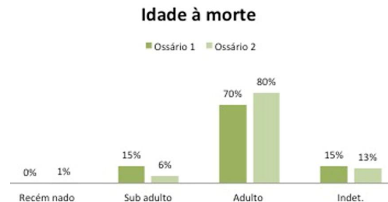
Fig. 12.— Percentagens da idade à morte presentes no ossário 1 [1013] e ossário 2 [1102]

Da observação dos dados paleodemográficos podemos constatar no Ossário 1 uma maior representação dos adultos (de 70%) em relação aos sub-adultos/ infantis, os quais assumem uma percentagem idêntica à dos indeterminados (de 15%). Observamos ainda um número exageradamente elevado (92%) de indeterminados no que diz respeito à diagnose sexual, sendo os valores muito semelhantes entre ambos os sexos, pouco relevantes na consideração final desta análise. No Ossário 2, fruto das epífises fragmentadas e das calotes partidas, o número de indeterminados é muito elevado, com percentagens superiores aos