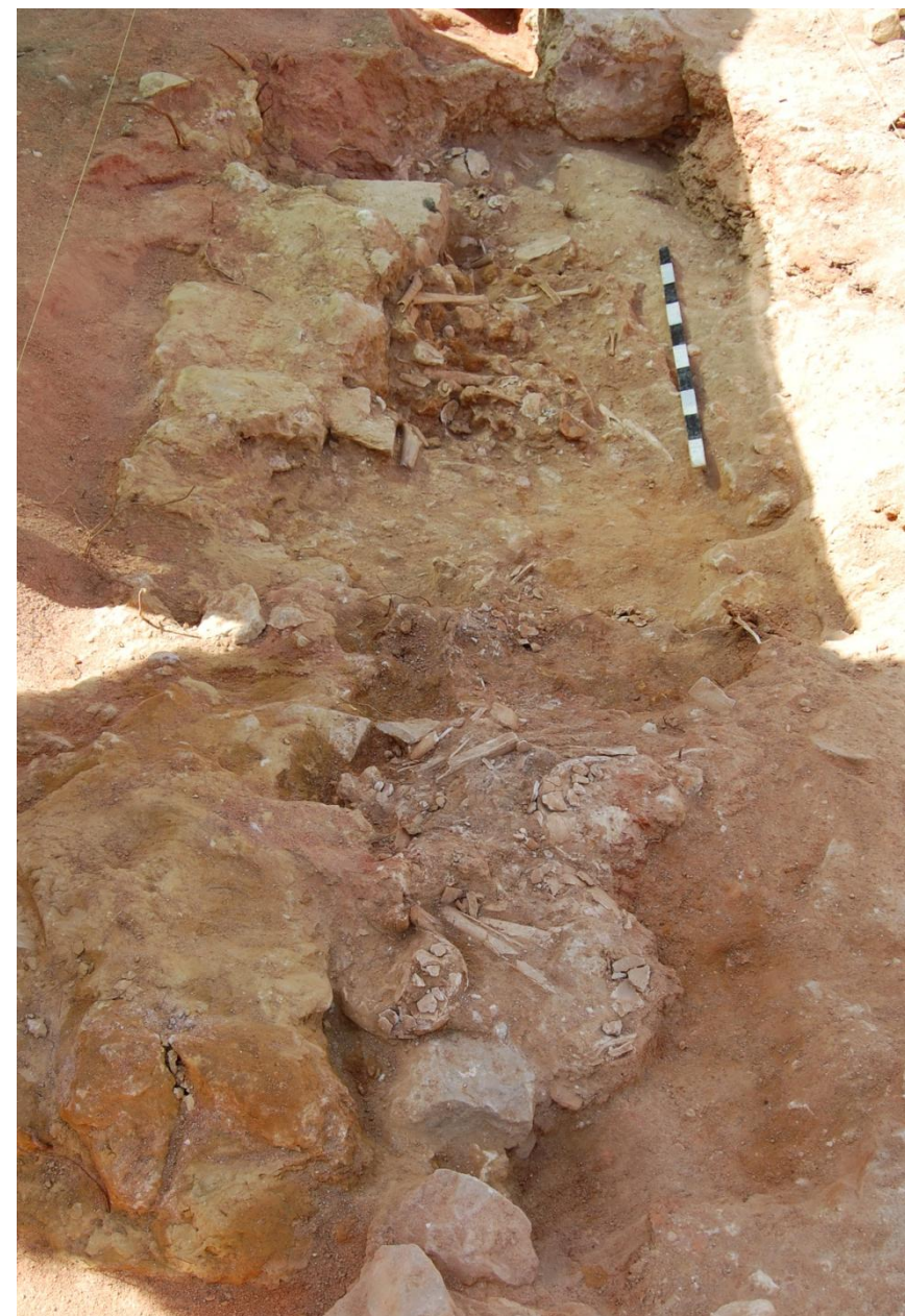
Fig. 10. — Aspecto geral do ossário 2 [1102]

Mais uma vez, após o desmonte de [108] registaram-se, em fase de acompanhamento, vestígios arqueológicos e osteológicos sob esta estrutura contemporânea. Identificou-se, deste modo, um grande bloco composto por pedra variada e argamassa muito compactada, aparentemente resultante de um despejo indiferenciado, mas que se encontrava directamente sobre o ossário 2 (Fig. 10). Este despejo foi feito ainda com a argamassa fresca na medida em que inúmeros fragmentos ósseos, nomeadamente crânios, se encontravam incrustados no dito bloco. Uma vez limpa a área registou-se um aterro [1100] que continha frequen-