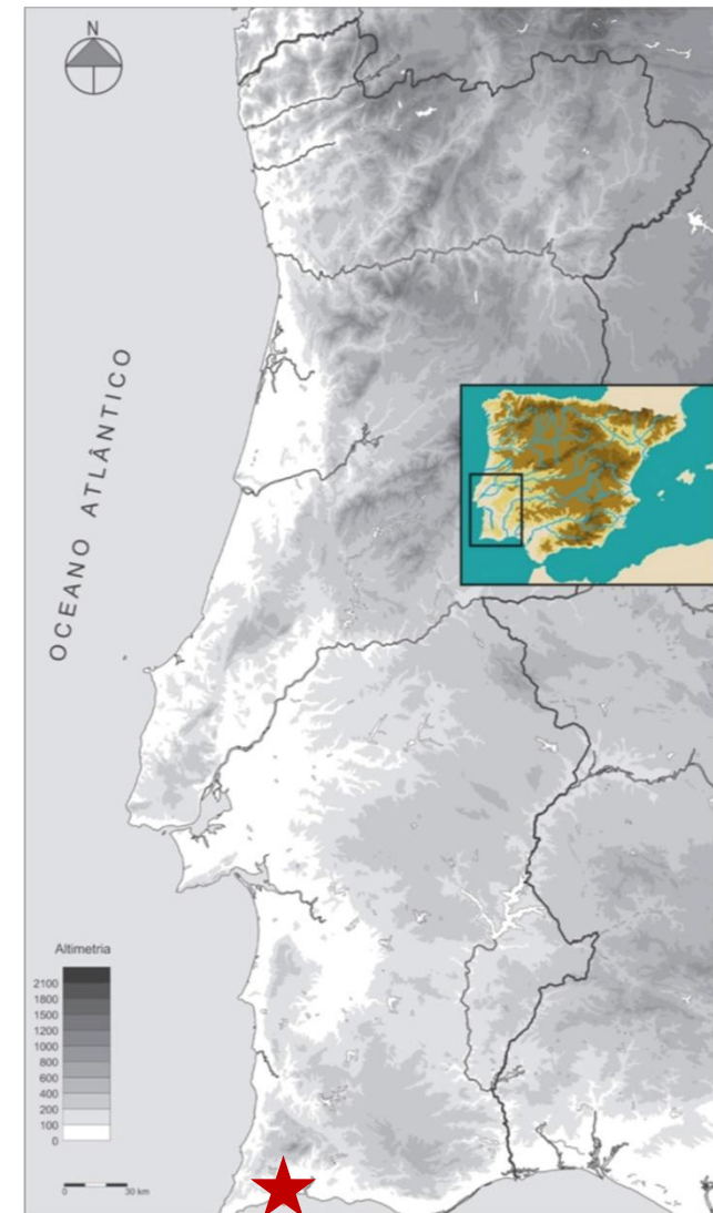
Fig. 1.— Localização de Lagos

O sítio intervencionado localiza-se no número 20 da Rua da Porta da Vila, em pleno centro histórico de Lagos (Figs. 1 e 2), imediatamente a Oeste da necrópole identificada no Largo de Sta. M a da Graça (Fig.3). Administrativamente