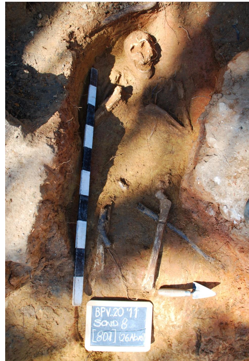
Fig. 5.— Inumação primária [807]

O indivíduo [1304] encontrava-se orientado de SO a NE, em decúbito dorsal (Fig. 6), conservando apenas os membros inferiores depositados paralelamente no interior de uma vala de morfologia rectangular, [1305]. Esta interface, à semelhança das demais, cortava o substrato geológico. A ausência da zona da bacia, tronco e crânio era fruto de uma outra vala [1315] de funcionalidade desconhecida que rompeu perpendicularmente com o contexto funerário.