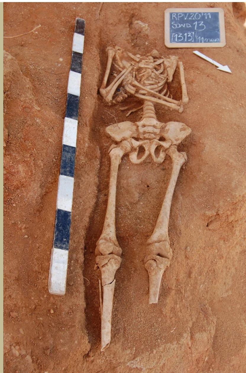
Fig. 7.— Inumação primária [1313]