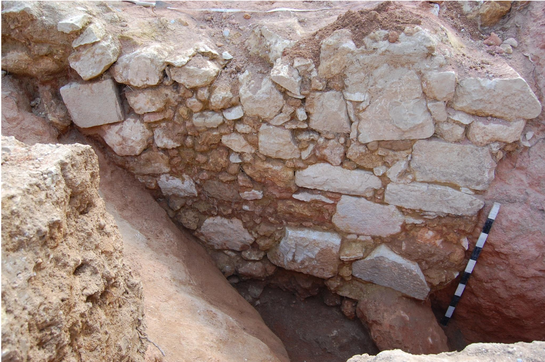
Fig. 11.— Alçado da estrutura [1127]