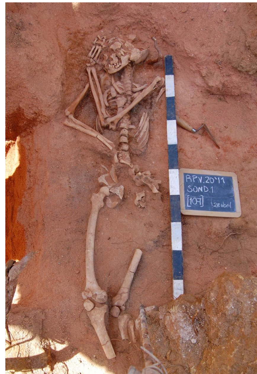
Fig. 4.— Inumação primária [107]

Um outro registo, na sondagem 8, correspondia a uma inumação primária da qual não se conservaram pés, tíbias, perónios e parte dos fémures (Fig. 5). Esta