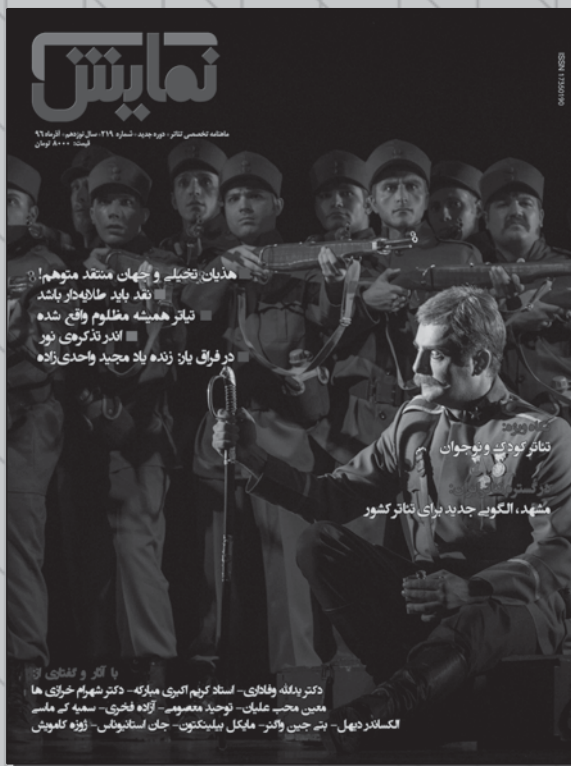
نمایش «شوایک، سرباز ساده‌دل» کارگردان: حمیدرضا نعیمی

تارنما: www.magazin.theater.ir رایانامه: namayesh_magazine@yahoo.com