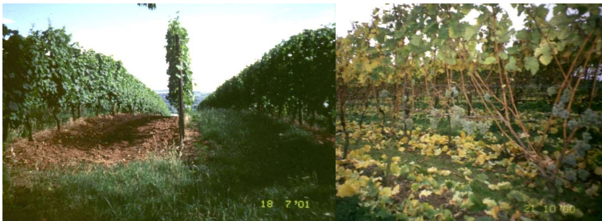
Figura 5- Condução tradicional na região de Rheingau – monoplane vertical ascendente (esq). Desfolha intensa para colheita tardia –auslese (dta)