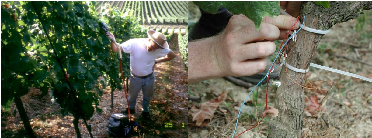
Figura 3- Medição da fotossíntese com um IRGA (esq) e instalação de sensores no tronco da videira para medição do fluxo de seiva (dta). Geisenheim, Julho 2001.

videiras do ensaio (casta Riesling). Os dados obtidos encontram-se em tratamento e serão objecto de publicações conjuntas num futuro próximo.