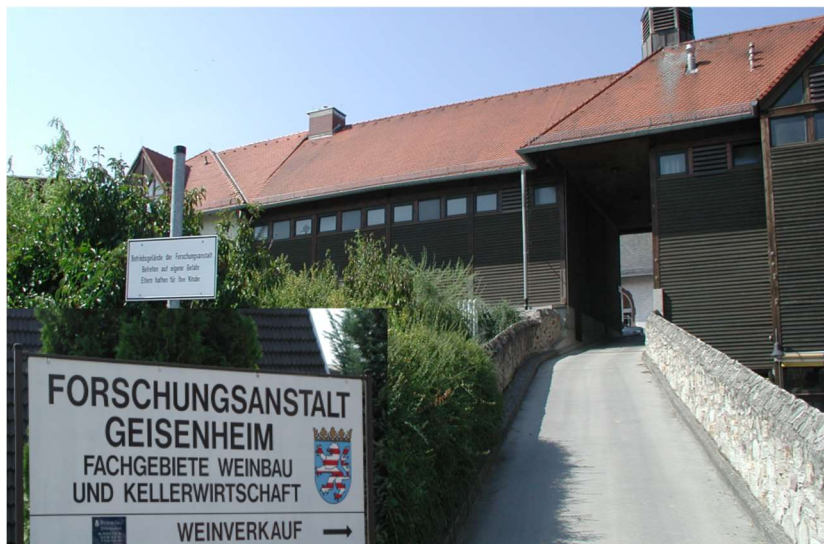
Figura 1 - Acesso aos Departamentos de Viticultura e Enologia do Instituto de Geisenheim, Alemanha.

O Forschungsanstalt Geisenheim é um Instituto de Investigação sob a tutela directa do Ministério das Ciências e da Cultura do Estado de Hesse. O Forschungsanstalt Geisenheim foi criado em 1872 com a designação de "Centro Real do Ensino da Arboricultura e Viticultura". Tinha como objectivo o ensino superior daquelas áreas científicas durante 4 semestres. Foi rapidamente reconhecido que o ensino não devia estar separado da investigação científica e, em 1987, o Forschungsanstalt Geisenheim foi dividido em 5 Institutos compreendendo 14 Unidades de Investigação. Cinco unidades dedicam-se à investigação e experimentação no domínio da Viticultura, da Enologia e da Tecnologia de Bebidas (Fig. 1). Quatro unidades ocupam-se das áreas de Horticultura, Arboricultura e Arquitectura Paisagística. As restantes 5 unidades trabalham simultaneamente no sector da Viticultura e da Horticultura.