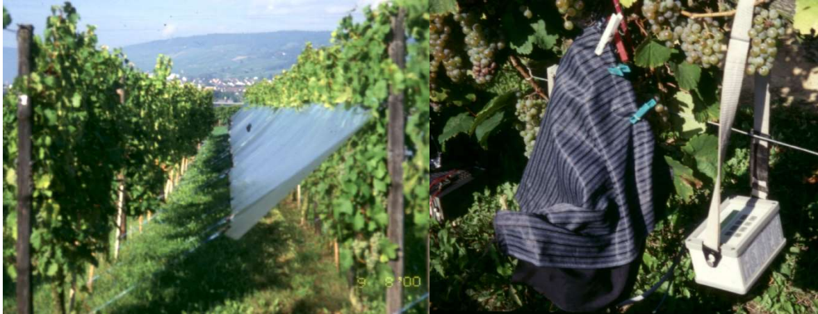
Figura 2 - Aspecto geral do ensaio sobre os efeitos da radiação UV na qualidade das uvas (esq) e pormenor da medição da fluorescência nos bagos (dta), Geisenheim, 2000.

ecológica de encosta de grande declive. Pretende-se analisar as alterações no armazenamento de água na planta e sua contribuição para a transpiração matinal; avaliar a contribuição da transpiração da cobertura vegetal (comparação de relvamento espontâneo, semeado e coberturas orgânicas mortas) no consumo de água da vinha e determinar os efeitos nas reservas da planta e na qualidade da uva e vinho.