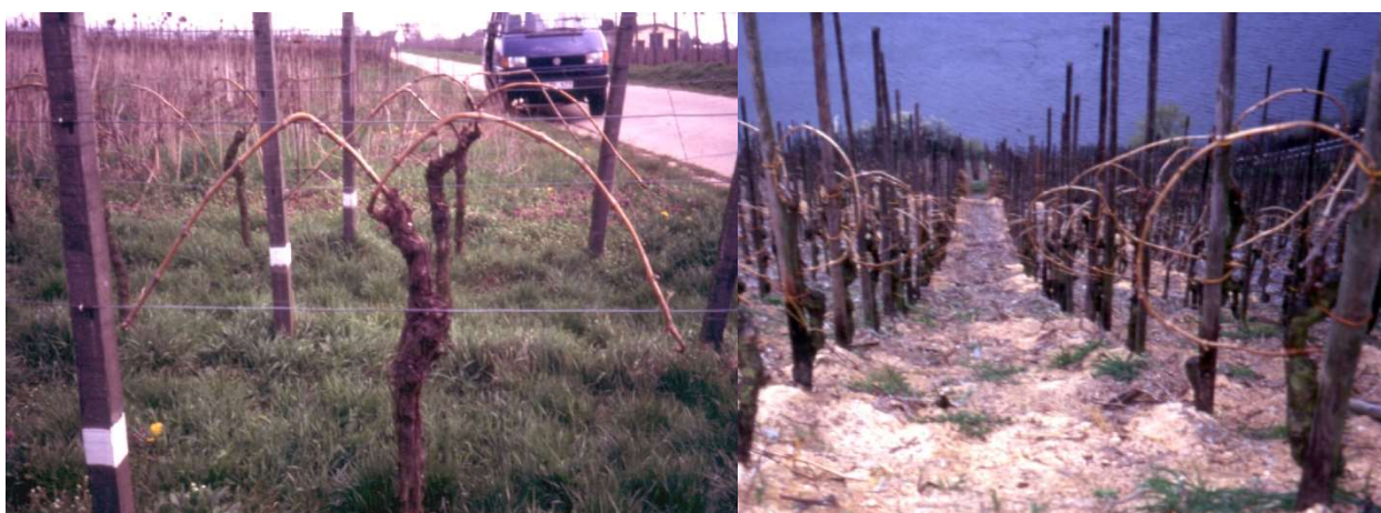
Figura 6- Sistema de poda tradicional utilizado na maioria das regiões vitícolas alemãs (esq) e nas encostas de grande declive da região do vale do Mosel (dta).

O sistema de manutenção do solo mais comum consiste no relvamento em linhas alternadas (Fig. 7 esq.), natural ou semeado, neste caso com base numa mistura de gramíneas, em particular o Lolium perenne e a Festuca rubra . Nas regiões de maior declive utilizam-se também coberturas orgânicas mortas, designadamente palhas e casca de pinheiro (Fig. 7 dta).