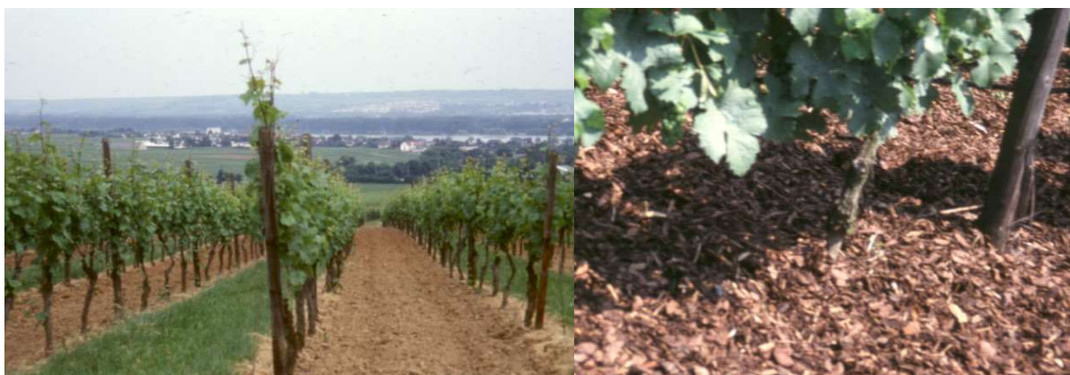
Figura 7- Sistemas de manutenção do solo: relvado natural alternado com mobilização (esq) e cobertura orgânica morta (dta).