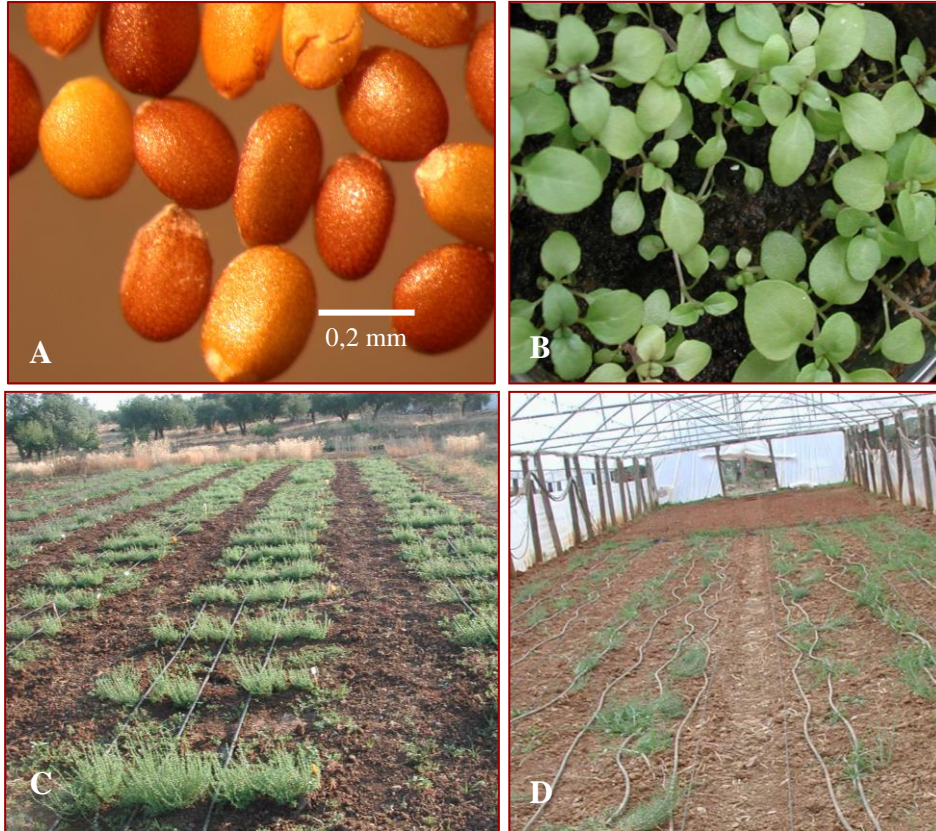
Figura 7 Poejo ( Mentha pulegium ): A - sementes; B – plântulas; C – cultura ao ar livre e, D – cultura em estufa (Empresa Estrela Afonso, Elvas).

propagação vegetativa com M. cervina verificou-se que as taxas de sobrevivência são mais elevadas quando se propagam estacas terminais e quando o substrato é uma mistura de turfa e perlite (1:1) (Monteiro, 2006).