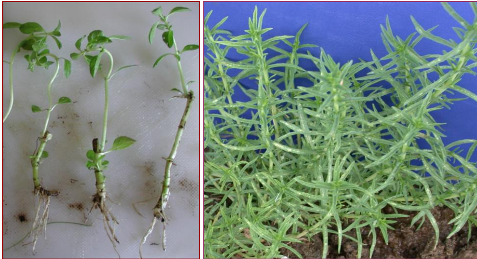
Figura 8 Estacas enraizadas de poejo ( Mentha pulegium - esquerda) e jovem planta de poejo-fino ( Mentha cervina ) resultante do enraizamento de estaca rizomatosa plantada ao ar livre (direita).

A rega, das plantas em cultura, quer por aspersão quer por rega gota a gota (Figura 7C e 7D) é uma prática fundamental uma vez que ambas as espécies são características de sítios húmidos e pantanosos.