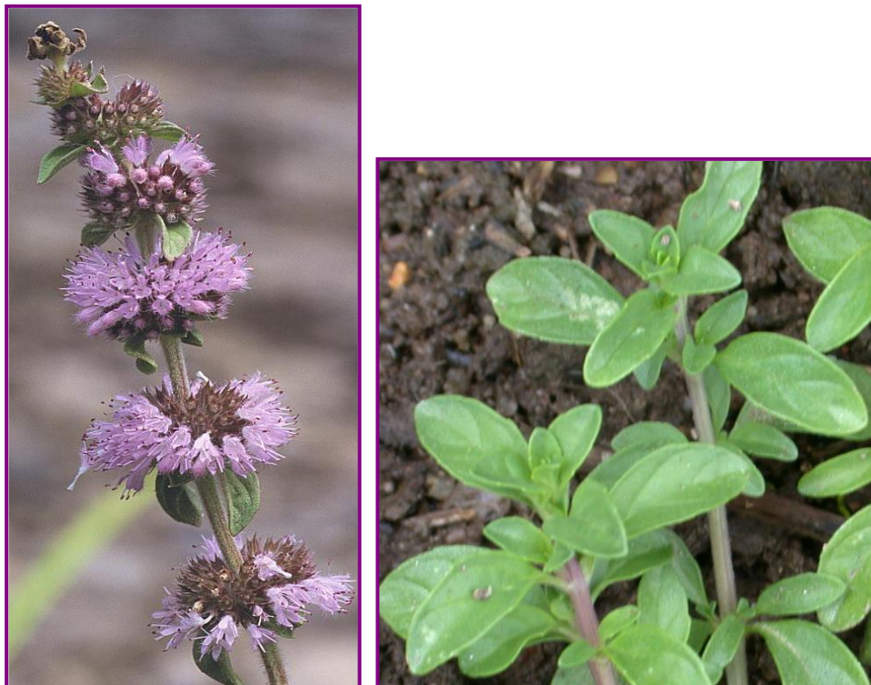
Figura 5 Mentha pulegium L. Inflorescências e flores (esquerda) e folhas (direita).

Geograficamente, o poejo, distribui-se pelo Sul da Europa, Nordeste de África, Ásia Ocidental (Valdés et al. , 1987). Em Portugal encontra-se em floração entre Junho e Agosto (Coutinho, 1974) mas na região da Andaluzia Ocidental este período alarga-se desde Maio/Junho a Outubro (Valdés et al. , 1987).