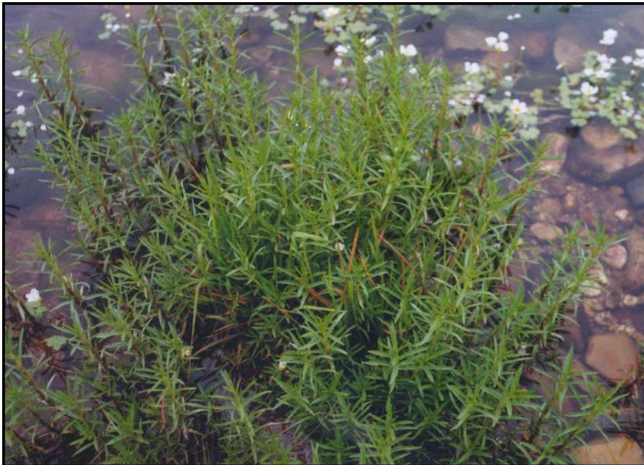
Figura 1 Pojo-fino ( Mentha cervina L.) numa ribeira afluente do Rio Xévora, Ouguela, Campo Maior.

Actualmente, poucos terão a noção de que o seu maior valor poderá ser como planta medicinal. Tradicionalmente, as folhas e ramos dos poejos ainda são utilizados, sobretudo pelos mais idosos, sob a forma de infusões ou de tisanas para curar algumas doenças, essencialmente relacionadas com o sistema respiratório e digestivo (Marinho, 2002).