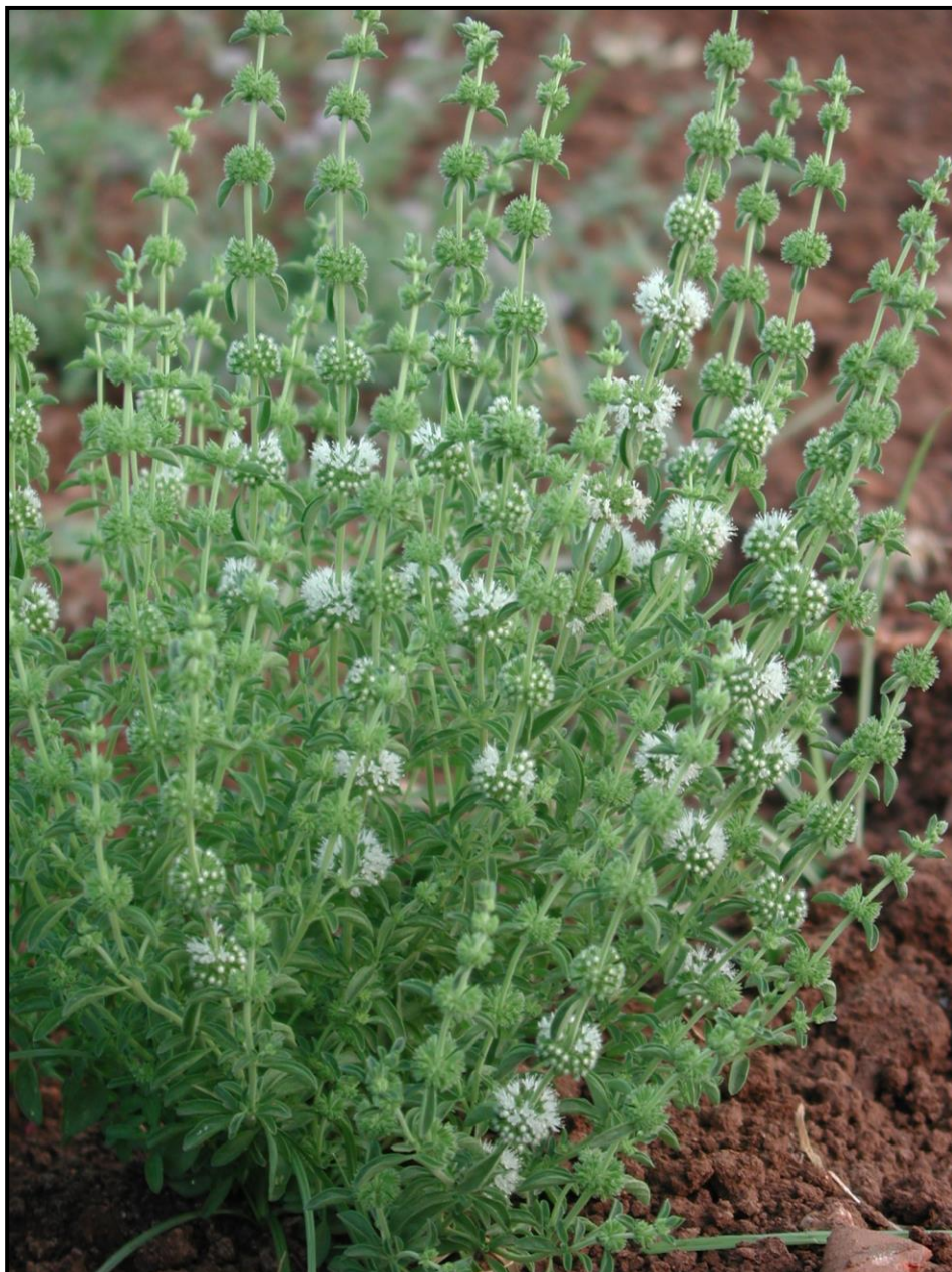
Figura 6 Ecótipo de Mentha pulegium L. de flor branca.