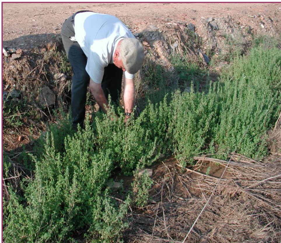
Figura 10 Colheita de poejo ( Mentha pulegium L.) para a preparação de piso, em Orada, Monforte.