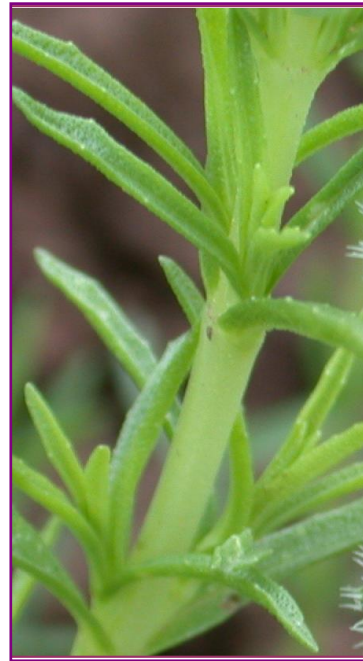
Figura 3 Mentha cervina L. – Ramo e folhas.

A espécie M. cervina (Figura 3 e 4) é um proto-hemicriptófito de 10-40 cm, com cheiro intenso, de caules prostrados e radicantes inferiormente, erectos acima. Possui folhas com 10-25 × 1-4 mm, linear-oblongadas, atenuadas na base, sésseis, glabras, inteiras ou sinuado-dentadas; brácteas mais largas que as folhas; cálice com 2-3 mm, de dentes triangulares prolongados num espinho esbranquiçado; corola com 5-6 mm, lilacénea ou branca; mericarpos ovóide-oblongos, lisos (Tutin et al. , 1972; Franco, 1984).