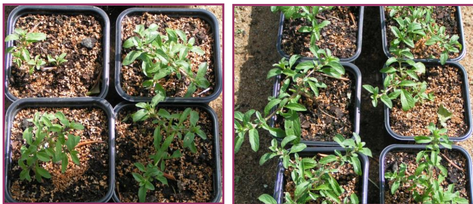
Figura 9 Aspecto das plantas de Mentha pulegium L. 2 semanas após a pulverização com 1,2 kg s.a./ha de bentazona (esquerda ) e 150 g s.a./ha de quizalofop-e-tilo (direita).

Apesar de não haver herbicidas homologados em Portugal para Mentha sp., a monda química é possível (Kothari et al. , 1991, Stougaard, 1998; Darré et al. , 2004). Estudos, em vasos, sobre a susceptibilidade a herbicidas de M. pulegium , após a plantação de estacas rizomatosas realizados no âmbito do Projecto Agro 522, mostraram que a pulverização com bentazona (1,2 kg s.a./ha) só muito ligeiramente afectou o crescimento, registando-se em seguida uma rápida recuperação das plantas. O tratamento com o herbicida anti-gramíneas quizalofop-e-tilo (50 e 150 g s.a./ha), como seria de esperar, não afectou a espécie (Figura 9).