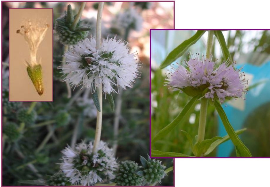
Figura 4 Mentha cervina L. – Inflorescências e flores brancas e lilacíneas (raras).