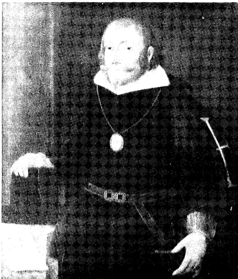
Salvador Correia de Sá Governador de Angola