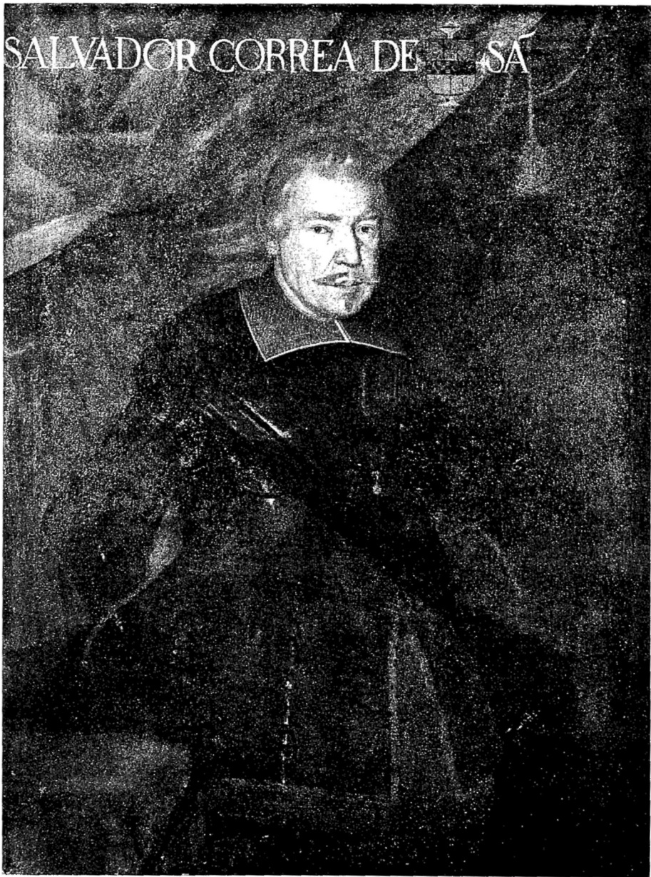
Salvador Correia de Sá Governador de Angola