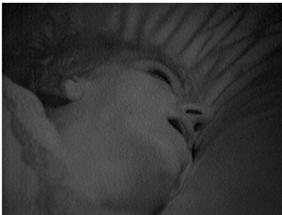
Figura 3: Bill Viola, The Passing (1990)

The Passing foi elaborado através de material gravado durante quatro anos, utilizando diferentes câmaras, sistemas de lentes e técnicas de gravação, Viola, através de imagens exclusivamente a preto e branco, consegue produzir uma variedade de efeitos estéticos na imagem. (Pühringer, 1994, p. 208) Mas para Bill Viola, mais importante que a câmara, o monitor ou o gravador, é o tempo a matéria do seu trabalho.