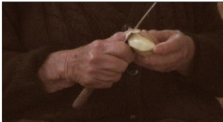
Figura 7: Ariel Roque Pinheiro, Deformações (2009)

Desde muito cedo parecia impulsivamente atraída pela minha bisavó, não só pela sua imagem, mas pelo que ela representava. Ainda na licenciatura realizei Deformações , um pequeno retrato videográfico sobre a memória guardada nas mãos da minha bisavó que outrora foram jovens. As mãos crescem, trabalham, sofrem, sentem, enrugam e deformam. O tempo marca as mãos, vinca-lhes histórias, gastando-as e deixando-as inúteis. Embora não soubesse o que realmente me interessava, parecia sentir um dever latente que procurei explicá-lo através da minha bisavó.