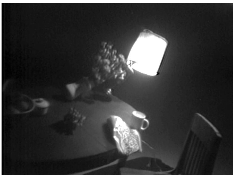
Figura 4: Bill Viola, The Passing (1990)

The Passing é o primeiro filme onde Bill Viola começou a usar a sua vida pessoal como inspiração. Aqui, a noção de responsabilidade está presa com um passado mais pessoal que histórico. Viola intercala imagens da sua mãe morrendo com imagens dos seus últimos anos de vida, sempre em conexão com imagens do seu primeiro filho em criança. A perda da sua mãe desperta-o para a alteridade, a antecipação da sua própria morte, bem com a de todos os outros seres. No entanto, perante a alteridade inatingível da sua mãe, o tempo abre espaço à reconciliação do passado que se liberta. «As recordações, à procura do tempo perdido, proporcionam sonhos, mas não devolvem as ocasiões perdidas.» (Lévinas, 1980, p. 261-262)