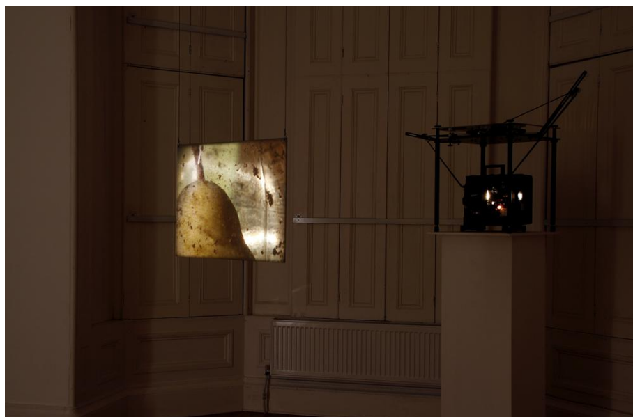
Figura 1: Tacita Dean, Prisoner Pair (2008)

Em 2008 Tacita Dean recebeu a comissão de fazer uma peça sobre a região da Alsácia-Lorena. Dean concebeu Prisoner Pair , com duas pêras numa garrafa de Schanapps suspensa, decompondo-se subtilmente à luz solar. O título do filme parte de um trocadilho com o nome de um licor que ainda se produz na Alsácia: poire prisonniere . Prisoner Pair funciona como um retrato poético de dois corpos (dois territórios), espelhos um do outro, que, mesmo enclausurados num vidro, fervem. De que modo Tacita Dean consegue fazer cristalizar estes dois corpos, que fermentam tão rapidamente para a decomposição?