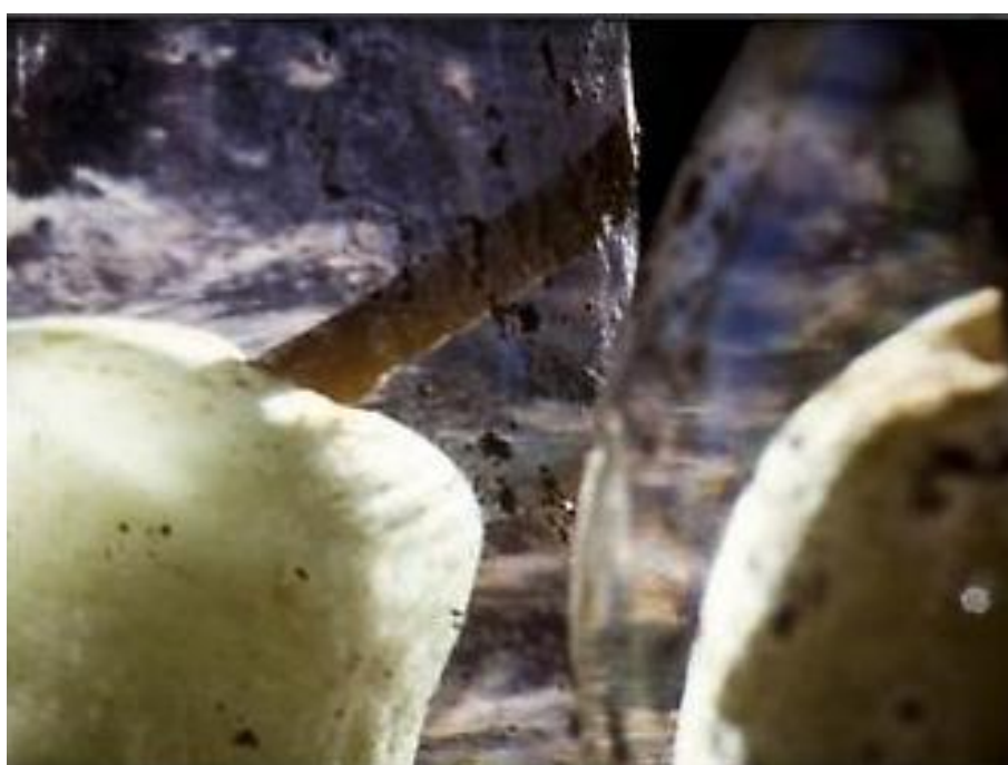
Figura 2: Tacita Dean, Prisoner Pair (2008). Still de filme 16mm.

Como um cristal em decomposição, Prisoner Pair é uma consequência de um passado desaparecido que sobrevive no cristal de forma artificial. Fora da garrafa e fora do plano, tudo desaparece, morre: nada se conserva fora do cristal. Toda a vida se desenrola dentro da garrafa, todo o real se torna espectáculo.