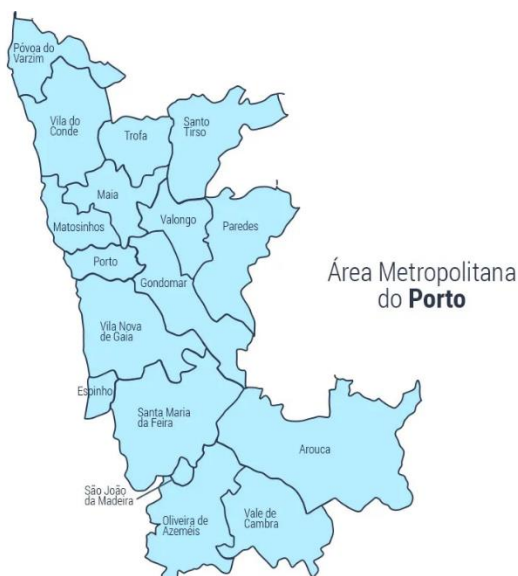
Mapa 1 -Municípios da Área Metropolitana do Porto – Fonte: Banco de Imagens do Google

A Área de Metropolitana do Porto é composta por 17 municípios, destes, 16 possuem Arquivo Municipal estando afetos aos mesmos 192 Profissionais da Informação variando o seu número entre os 111 do Arquivo Municipal do Porto, 19 de Vila Nova de Gaia e 1 ou 2 Profissionais da Informação em Arouca, Paredes, Santa Maria da Feira, Santo Tirso e Trofa.