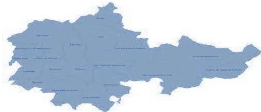
Mapa 4 - Municípios do Douro

A Região do Douro é composta por 19 municípios, destes 16 municípios possuem Arquivo Municipal estando afetos aos mesmos 39 Profissionais da Informação variando o seu número entre os 8 colaboradores em Vila Real e 1 em Alijó e Penedono.