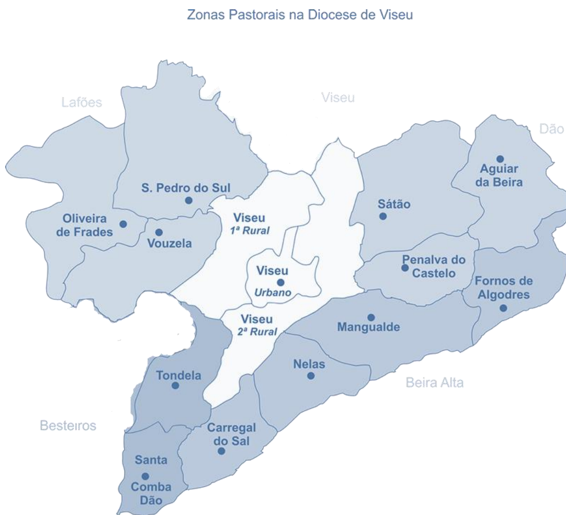
Mapa 6 - Municípios da Viseu, Dão e Lafões

A região de Viseu, Dão e Lafões é constituída por 14 municípios, dos Nove municípios com Arquivo Municipal estão afetos aos seus serviços 19 Profissionais da Informação variando o seu número entre os Três - em Mangualde, São Pedro do Sul e Viseu e Um - em Oliveira de Frades e Santa Comba Dão. É das 6 áreas de estudo a que possui o menor número de Profissionais da Informação afetos aos seus arquivos e a que possui o maior número de municípios sem Arquivo Municipal – 5.