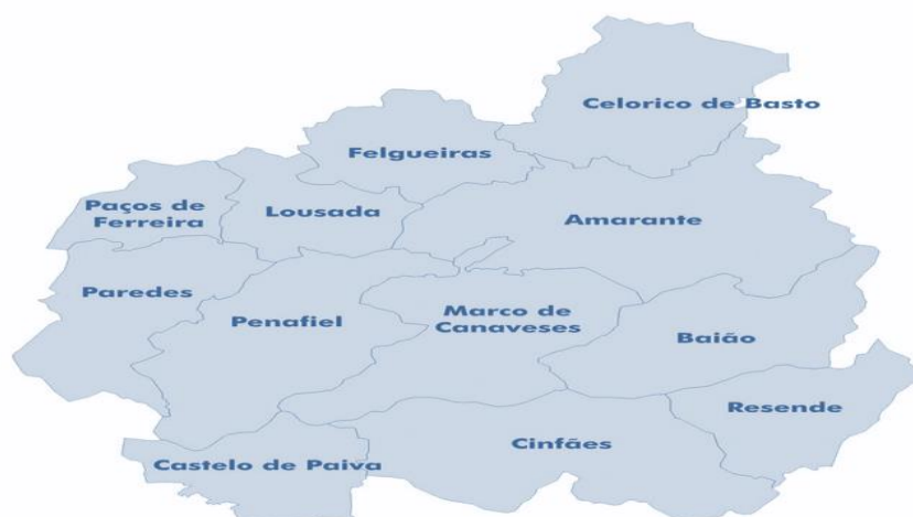
Mapa 2 - Municípios do Baixo Tâmega e Sousa

A Região do Baixo Tâmega e Sousa é composta por 11 municípios, destes, 9 municípios possuem Arquivo Municipal, estando afetos aos mesmos 24 Profissionais da Informação variando o seu número entre os 8 Profissionais da Informação em Amarante, e os um ou dois Profissionais da Informação em Baião, Celorico de Bastos e Lousada.