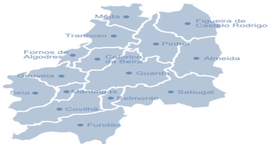
Mapa 3- Municípios das Beiras e Serra da Estrela

A Região das Beiras e Serra da Estrela é composta por 15 municípios, destes, 13 possuem Arquivo Municipal estando afetos aos mesmos 32 Profissionais da Informação variando o seu número entre os seis colaboradores em Gouveia e os um / dois colaboradores em Celorico da Beira, Manteigas, Covilhã e Pinhel.