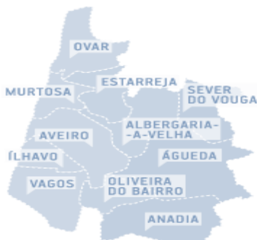
Mapa 5 - Municípios da Região de Aveiro

A Região de Aveiro é composta por 11 municípios, destes, 9 possuem Arquivo Municipal estando afetos aos mesmos 29 Profissionais da Informação variando o seu número entre os 8 em Albergaria-a-Velha e Aveiro e 1 Profissional da Informação – casos de Estarreja, Murtoza, Ovar e Sever do Vouga.