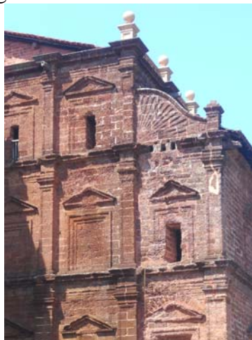
Fig. 4 - Basílica del Buen Jesús en Goa Vieja, elementos arquitectónicos sin revoco a degradarse poco a poco, 2015.