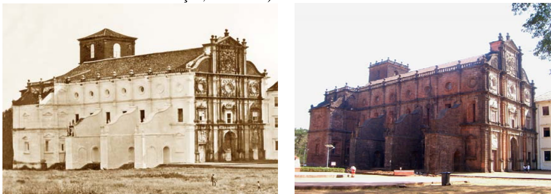
Fig. 2 – Basílica del Buen Jesús en Goa Vieja con el revoco, finales del siglo XIX.; Fig. 3 - Basílica del Buen Jesús en Goa Vieja sin el revoco, 2006.

La primera noticia sobre la intervención de Baltazar Castro en la Basílica del Buen Jesús es un telegrama del 13 de Octubre de 1951, del Gobierno-General del Estado da Índia, que pedía al arquitecto instrucciones para completar los trabajos ya empezados. El documento estaba acompañado de una fotografía que mostraba la excavación ordenada por el arquitecto en la parte inferior de las paredes de la basílica, con la intención de recuperar el nivel inicial del piso 11 . Las acciones siguientes pasaron por renovar las infraestructuras sanitarias, arreglar las cubiertas, reparar y pintar partes del interior del edificio, consolidar la torre del campanario, sustituir su tejado por una terraza y construir un nuevo crucero en la parte exterior trasera de la basílica. Pero la operación más impactante fue la remoción del revoco de las fachadas exteriores de la basílica, dejando la piedra de laterita expuesta a los efectos climáticos, y al mismo tiempo, cambiando drásticamente su imagen (Costa, 1954: 17-18; Neves, 1953: 1 y 4; Central de Estatística e Informação, 1952: 122).