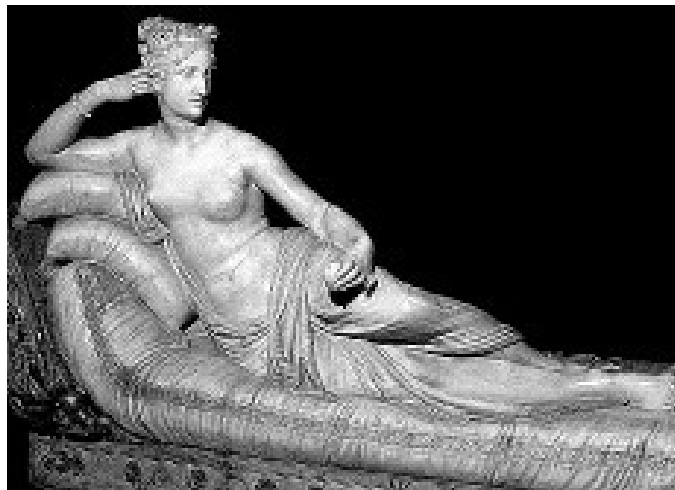
Figura 5 - Schwanke. A Vênus triunfante . Pauline Borghese Bonaparte de Canova , 1979. Figura 6 - Antonio Canova. Pauline Borghese como Venus . 1805-08