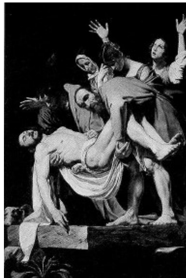
Figura 3 · Swanke. Claro- Escuro . Instalação que utiliza holofotes, espetos e uma plotagem de Obra de Caravaggio. 2x3 m comprimento x 2,3 de largura., 1 m profundidade. 2003. Moinho Novo Rebouças, Curitiba, Paraná.