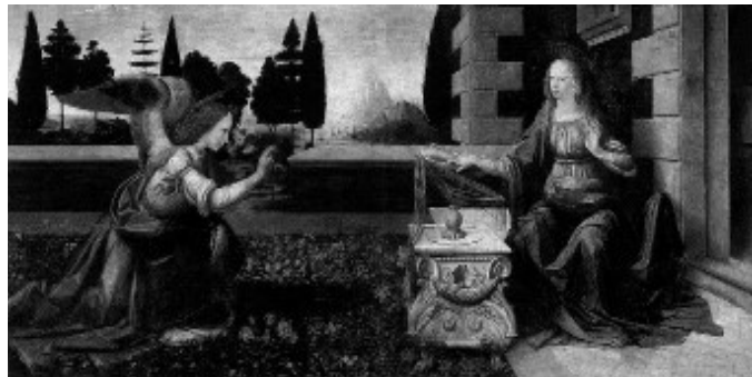
Figura 7 · Schwanke. Anunciação de Leonardo . 1979. Figura 8 · Leonardo Da Vinci. A Anunciação . 1472-75.