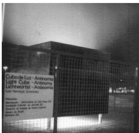
Figura 1 - Schwanke. Cubo de luz , Antinomia . 1991. Bienal Internacional de Sao Paulo.